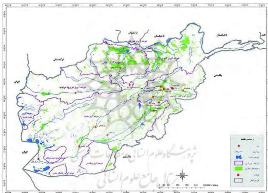
نقشه ۳- موقعیت سدهایی که بر رودخانه‌های جاری در افغانستان احداث شده‌اند

صورت مساوی تعیین شد. از اواخر سال ۱۳۷۹ عملیات احداث سد پس از تکمیل سیستم انحراف آن آغاز شد. طبق برنامه سخت سد باید در سال ۱۳۸۴ به پایان می‌رسید اما با تشخیص مقامات عالی دو کشور احداث آن یک سال زودتر پایان یافت و سهم هر کشور از مجموع ۸۲۰ میلیون متر مکعب آب قابل تنظیم آن ۴۱۰ میلیون متر مکعب تعیین شد. افزون بر ذخیره سازی و تنظیم آب رودخانه هریرود تأمین آب کشاورزی دشت در ایران و ترکمنستان و مهار سیلاب جلوگیری از خسارت سیل اهداف مورد نظر از احداث سد دوستی هستند (Sinaii, 2011 : 209). در مورد افغانستان نیز یکی از راهکارهایی که می‌شود در این باره مطرح کرد تا افغانی‌ها این اعتماد را پیدا کنند و بر سر میز مذاکره با ایران بنشینند اطمینان جمهوری اسلامی ایران برای کمک به توسعه افغانستان و طراحی یک پلان و نقشه راه در این رابطه است.