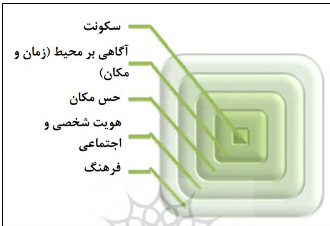
شکل ۲: تاثیر متقابل فرهنگ و سکونت‌گزینی