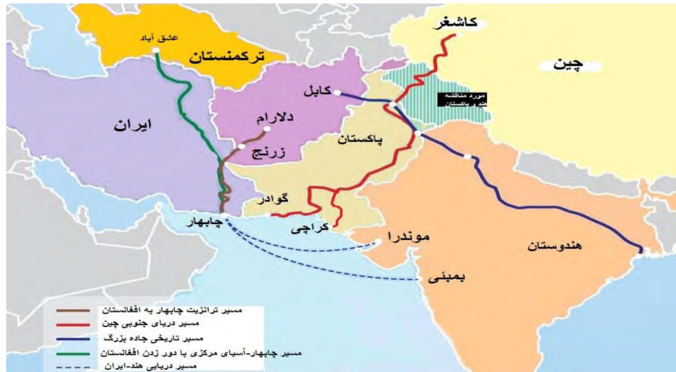
نقشه شماره (۴)

از سوی دیگر با وجود اختلافات آمریکا و پاکستان در مورد موضوعاتی چون صلح با هند، برنامه هسته ای و ضد تروریسم، منافع ایالات متحده آمریکا بر روابط پایدار افغانستان و روابط صلح آمیز هند و پاکستان که برای رونق اقتصادی پاکستان مهم است، متمرکز است. با این حال ثبات منطقه ای مدنظر ایالات متحده آمریکا و رقابت استراتژیک چین با ایالات متحده آمریکا چالشی در ثبات منطقه ای و رونق اقتصادی آسیای جنوبی بوجود آورده است.