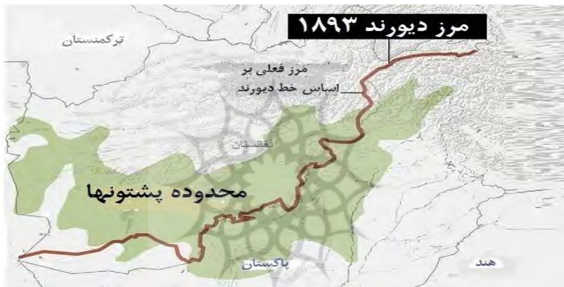
نقشه شماره (۲)

این خط برای پاکستان یک مرز بین المللی شناخته می شود با این حال، افغانستان با بیان اینکه این امر توسط انگلیسی ها به امیر کابل، عبد الرحمن خان تحمیل شده است، خط دیورند را به عنوان مرز بین المللی خود به رسمیت نمی شناسند. منطقه قبیله ای نیمه خودمختار که در شمال غربی پاکستان واقع شده از شرق و جنوب توسط خیبر پختونخوا و بلوچستان احاطه شده است، در حالی که همسایگان مناطق قبیله ای در غرب و شمال استان های کنر، ننگرهار، پکتیا، خوست و پکتیکا افغانستان در طول خط دیورند قرار دارند. تراکم جمعیت در مناطق قبیله ای ۶۳ نفر در هر کیلومتر مربع است. از نظر جغرافیایی تمام مناطق قبیله ای به شکل هلالی در امتداد مرز افغانستان واقع شده اند. به دلیل جغرافیای خاص آن، حتی اجماع نظر در مورد کلیت سرمایه گذاری اقتصادی ممکن است دشواری های را به وجود آورد.