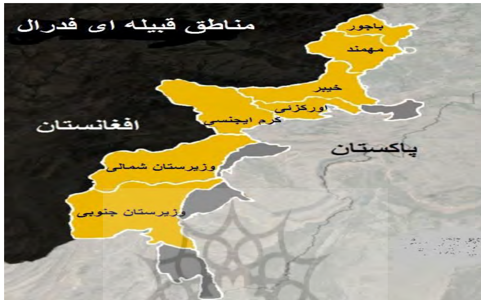
نقشه شماره (۳)

مناطق قبیله ای فدرال به طور اداری به هفت ناحیه قبیله ای تقسیم می شود که هر یک دارای مقرهای اداری مختلف هستند که به کارگزاری های قبیله ای موسومند (نقشه شماره ۳). در راس هر منطقه قبیله ای، یک کارگزار سیاسی که نماینده مستقیم رئیس جمهور است قرار دارد. منطقه قبیله ای تحت نظارت فدرال که بخشی از پاکستان است، نحوه مدیریت و سیاست آن با سایر مناطق کشور کاملاً متفاوت است.