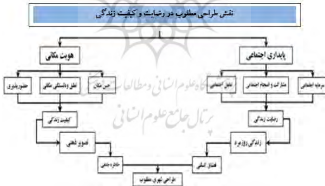
شکل ۴. مدل مفهومی پژوهش

در این پژوهش با استفاده از پرسشنامه و تحلیل آماری توسط نرم افزار spss و سپس برای تبیین مدل مفهومی با استفاده از نرم افزار آموس گراف به تحلیل داده‌ها پرداخته شده است. مدل مفهومی این پژوهش به صورت شکل ۴ است: