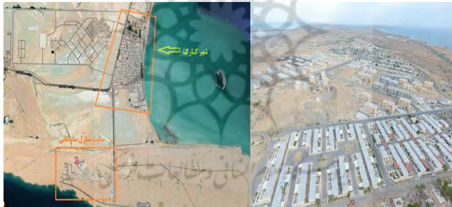
شکل ۲. تصویر هوایی از شهرک و موقعیت آن

روش تحقیق پژوهش توصیفی-تحلیلی با رویکرد کاربردی است. داده‌ها با استفاده از پرسشنامه گردآوری شده‌اند. با توجه به جمعیت منطقه برای تعیین حجم نمونه از فرمول کوکبان استفاده شد. پرسشنامه ۲۷ گویه‌ای با مشورت خبرگان معماری و روانشناسی طراحی شد و تعداد ۱۵۰ خانوار پرسنل نیروی دریایی ارتش جمهوری اسلامی ایران که در منازل سازمانی واقع در سواحل دریای عمان حضور داشتند این پرسشنامه‌ها را تکمیل کردند. لازم به ذکر است یک‌بار پرسشنامه آزمایشی با تعداد ۳۰ عدد توزیع شد و مشکلات و نکات مبهم در پرسشنامه اصلی رفع شد. برای تجزیه و تحلیل داده‌ها از نرم‌افزار Amos و SPSS استفاده شده است. بر اساس تحلیل عاملی و ساختار مسیر سعی بر آن بوده است که روابط مابین مدل چهارچوب نظری مورد بررسی و تأیید قرار گیرد که در ادامه به آن پرداخته می‌شود. کنارک در استان سیستان و بلوچستان، حاشیه چابهار (در ۵۵ کیلومتری شرق آن) و ساحل دریای عمان واقع شده. در هم‌جواری این شهرها، منازل مسکونی سازمانی متعلق به ارتش جمهوری اسلامی ایران (نیروی دریایی و هوایی) قرار دارد با طول جغرافیایی منطقه ۲۵ درجه و ۱۹ دقیقه و ۵۷ ثانیه و عرض جغرافیایی ۶۰ درجه و ۲۲ دقیقه و ۵۴ ثانیه. شهرک نیرو دریایی در مجاورت این شهر در حدود ۱۵۰۰ واحد مسکونی ویلایی و آپارتمانی قرار دارد که در شکل شماره ۲۱ مشاهده می‌نمایید.