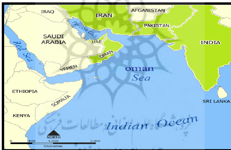
نقشه (۱) کشورهای سواحل دریای عمان

همان‌طور که در شکل شماره یک اشاره شده است؛ فرآیند هم‌گرایی در این مناطق ژئوپلیتیک دارای سطوح تدریجی و مراحل بالا است. از مرحله هم‌گرایی فنی، تخصصی آغاز می‌شود و در شرایط کاهش کدورت و افزایش صمیمیت بین اعضا و کشورهای منطقه به تدریج به سطوح بعدی و نهایتاً