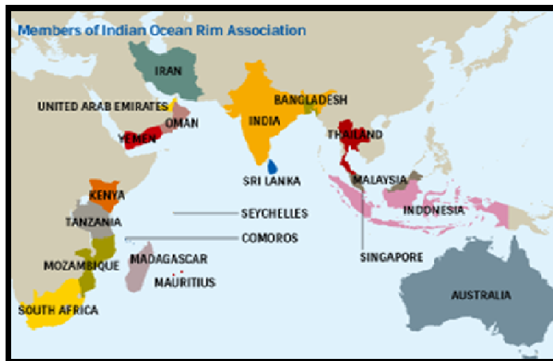
نقشه ۲) نقشه کشورهای عضو اتحادیه منطقه‌ای حاشیه اقیانوس هند

می‌شود. در چنین شرایطی، آب به نحو اجتناب‌ناپذیری به یک مقوله سیاسی و امنیتی تبدیل می‌شود. در نتیجه سیاست، امنیت و آب به یکدیگر پیوند می‌خورند [۴۶]. امتزاج عنصر قدرت به این سه مؤلفه دیگر هیدروپلیتیک را به ارمغان می‌آورد که هر کشور در مناقشات داخلی (استانی و شهری) و خارجی متأثر از مباحث آن می‌باشد.