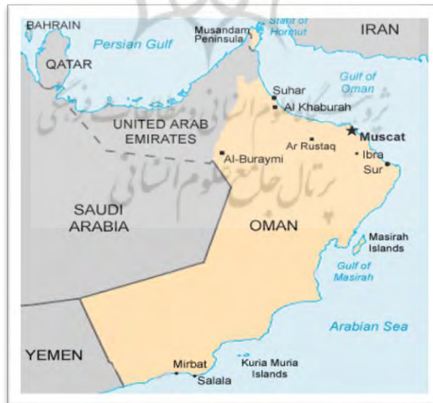
نقشه ۱.

عمان و امارات نیز مانند سایر کشورهای عربی حوزه خلیج فارس دارای اختلافات مرزی و سرزمینی‌اند. امارات بین دو قسمت شمالی و جنوبی عمان جدایی انداخته است (نقشه ۱). عمان خواهان راهی است که آن کشور را به شبه‌جزیره مسندم از طریق فجیره ۱ و شارجه ۲ متصل کند؛ درحالی‌که امارات مخالف این درخواست عمان بوده و این مخالفت سبب درگیری مسلحانه بین دو کشور در سال ۱۹۷۹ گردید و دو کشور تا مه ۱۹۹۱ از هرگونه روابط کامل دیپلماتیک خودداری کردند. البته، عمان با دریافت کمک مالی سالانه از امارات متحده عربی، ادعاهای ارضی خود را مسکوت گذاشت و با برقراری روابط سیاسی و سفر متقابل سران دو کشور اختلافات موجود شدیداً کاهش یافت. باوجوداین، اختلافات بین عمان و امارات در شبه‌جزیره مسندم به‌صورت یک منبع تنش بلندمدت درآمده است؛ به‌گونه‌ای که در ۸ نوامبر ۱۹۹۲ بین دو کشور بر سر منطقه مسندم برخورد نظامی صورت گرفت و چند نفر از افراد دو کشور کشته شدند. دو کشور از تبادل سفیر خودداری کردند تا اینکه در سال ۱۹۹۹ در خصوص مرز آن‌ها توافقی صورت گرفت (جعفری ولدانی و جعفری ولدانی، ۱۳۹۱: ۸۷-۹۳). دوپارگی و دو بخش بودن قلمرو عمان و فقدان راه زمینی مستقل بین سرزمین اصلی عمان و شبه‌جزیره مسندم، در صورت بحران، می‌تواند مانعی بر اعمال حاکمیت رژیم عمان بر این منطقه باشد (همان‌طور که در پاکستان پیش آمد و بخش شرقی آن، بنگلادش، از آن جدا شد). به خاطر جدایی سرزمینی چنانچه در شرایطی خاص قدرت‌های خارجی حاکمیت عمان را بر بخش جنوبی تنگه هرمز به مصلحت خود ندانند، به‌راحتی می‌توانند وسیله جانشین این بخش از سرزمین عمان را فراهم آورند. به‌خصوص در صورتی که رژیمی مخالف با منافع این قدرت‌ها در این کشور زمام امور را در دست گیرد (پولاب، ۱۳۹۸).