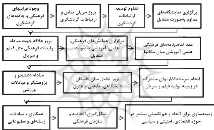
شکل ۱. هم‌تکمیلی فرهنگی (واثق و همکاران، ۱۳۹۵)

بین ایران و مناطق ژئوپلیتیکی فعال پیوندهای تاریخی و اشتراکات فرهنگی جریان‌سازی وجود دارد. سرزمین ایران، به‌عنوان اقتصادی‌ترین مسیر برای کشورهای منطقه، به‌منظور دستیابی به آب‌های آزاد و بازارهای جهانی، موقعیت راهبردی مناسبی برای ایران فراهم کرده است و باعث می‌شود برای گسترش روابط اقتصادی و هم‌تکمیلی زمینه‌های جغرافیایی و تاریخی فراهم شود (هرسیج و همکاران، ۱۳۸۸: ۵۶). پیوندهای قومی و مذهبی را می‌توان نام برد که با داشتن ظرفیت گردشگری و قرابت فرهنگی و مذهبی با چند کشور منطقه نتایج بالایی تولیدات علمی و نخبگان علمی، هویت فراملی و فرامرزی زبان فارسی از جمله عناصر و اجزای فرهنگی ایران است که می‌تواند بسترهای فعالی برای همگرایی و هم‌تکمیلی منطقه‌ای باشد. درواقع، ایران با داشتن این امتیازات می‌تواند، علاوه بر پی‌ریزی منطقه‌گرایی فرهنگی، از شاخص‌های اقتصادی آن هم بهره‌مند شود؛ زیرا ایران بالاترین قدرت نرم‌افزاری و هژمون فرهنگی در منطقه جنوب غرب است که این امتیاز می‌تواند در تعاملات اقتصادی (از جمله صادرات و واردات) نقش بسزایی داشته باشد (گل‌کرمی و همکاران، ۱۳۹۷: ۵). شکل ۱ الگوی راهبردی هم‌تکمیلی فرهنگی به‌عنوان یکی از اصول منطقه‌گرایی ایران را نشان می‌دهد.