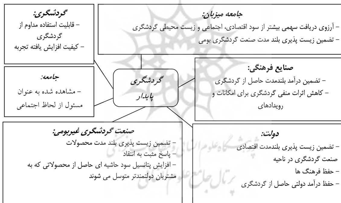
شکل (۲): دلایل متفاوت برای گردشگری پایدار

باید گفت مفهوم توسعه پایدار نیازی به معایرت با مفهوم توسعه اقتصادی ندارد. مدافعان توسعه پایدار اذعان می‌کنند که پیشرفت اقتصادی برای کاهش فقر، بهبود ارزش زندگی و ترقی به سمت ایمنی محیط زیست ضروری است. بنابراین باید یک استراتژی متعادلی برقرار شود تا اطمینان حاصل شود که رشد گردشگری، فشار شدید به منابع طبیعی وارد نمی‌کند (Khuntia and Mishra, 2014: 23). چرا که گردشگری یک بخش اقتصادی است که نه تنها نتایج مثبتی به همراه دارد بلکه تأثیرات منفی جدی نیز دارد. با این حال، گردشگری پایدار اقدامی است که می‌تواند تعادل بین توسعه اقتصادی و حفاظت از محیط زیست در کنار حفظ حساسیت فرهنگی - اجتماعی حفظ کند. در هر تحقیق علمی مطالعه و بررسی تحقیقات و پژوهش‌هایی که در ارتباط با موضوع انجام شده،