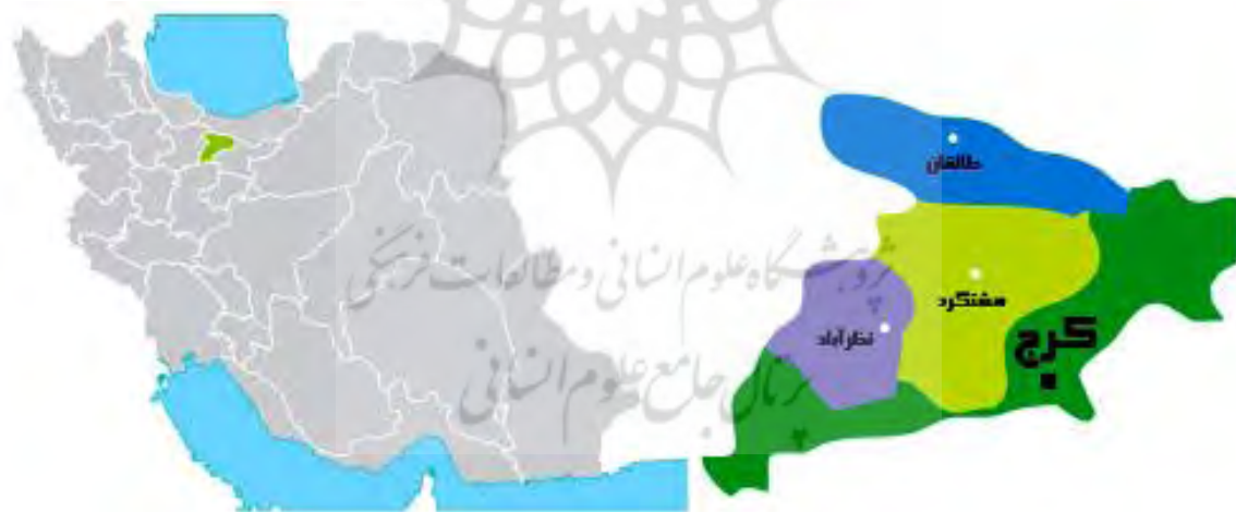
شکل ۱. موقعیت کلان‌شهر کرج در کشور

0 شهر کرج از قابلیت‌های جذب گردشگر در زمینه طبیعی، تفریحی، علمی - دانشگاهی و ورزشی برخوردار است.