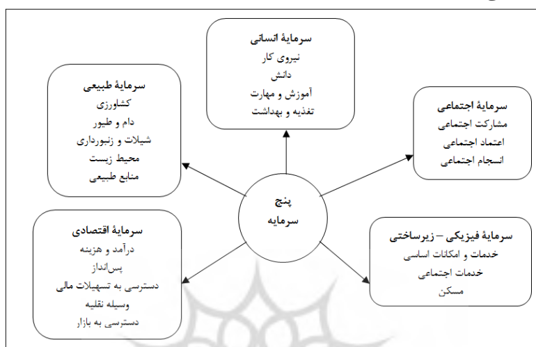
شکل ۲- مدل مفهومی تحقیق (منبع: نگارندگان، ۱۳۹۹)

تسهیل و گسترش روابط اجتماعی با توجه به اهمیت این روابط برای ساماندهی بهینه زندگی اجتماعی؛ ۲- نتایج مطلوب ناشی از کاربرد این روابط تسهیل شده برای ایجاد و انسجام اجتماعی و رفاه (دانشنامه مدیریت شهری و روستایی، ۱۳۸۸: ۴۵۲). در نهایت