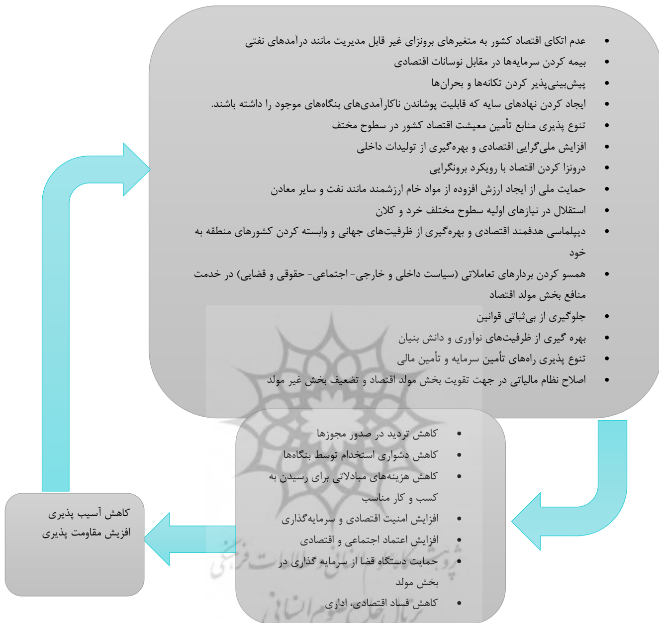
نمودار (۲). الگوی مفهومی ارتباط سهولت فضای کسب و کار و تحقق اهداف مقاومت اقتصادی