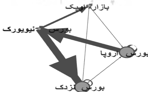
شکل (۳): شبکه سوم بحران بدهی اروپا

در زمان بحران بدهی اروپا، بیشترین معیار نزدیکی را بازار نفت اوپک دارد، که به معنی بیشترین میزان آسیب در زمان بحران بدهی اروپا است. بیشترین تأثیرگذاری را بورس نزدک و بورس اروپا دارد و بیشترین تأثیرپذیری را بازار نفت اوپک داشته است.