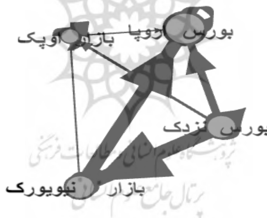
شکل ۲. شبکه دوم بحران مالی آمریکا

در زمان بحران مالی آمریکا، بیشترین معیار نزدیکی راه بورس اروپا و نفت اوپک دارند، یعنی بیشترین آسیب به آنها وارد شده است. بیشترین تأثیرگذاری را بورس نیویورک، بورس نزدک و بورس اروپا داشته‌اند و بیشترین تأثیرپذیری را بورس اروپا و نفت اوپک دارند و این تأثیرپذیری بالا و معیار نزدیکی بالا در زمان بحران مالی، سبب ایجاد بحران بدهی در اروپا شد.