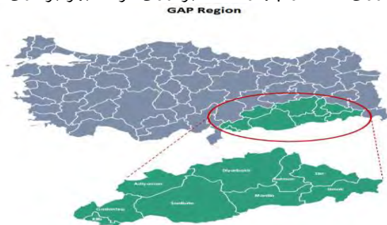
منطقه سبز محل اجرای پروژه گاپ

شامل احداث ۲۲ سد و نوزده نیروگاه برق آبی بر روی رودخانه‌های دجله و فرات و انشعابات آن می‌شود. در پایان سال ۲۰۱۹ دولت ترکیه که ۳۲ میلیارد دلار در پروژه گاپ سرمایه‌گذاری کرده است (وبسایت پروژه گاپ، ۲۰۱۱: ۵)، توانست از هشت سد بر روی دجله و چهارده سد بر روی فرات بهره‌برداری کند.