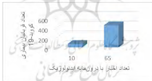
شکل ۴- تعداد اخبار ایدئولوژیک مربوط به بیماری کووید-۱۹

علاوه بر این، بررسی آماری استفاده وزارت بهداشت ایران از شعارهایی با درون‌مایه مذهبی نشان می‌دهد که در برهه‌هایی خاص و زمانی که آمار مبتلایان و قربانیان بیماری کووید-۱۹ سیر صعودی به خود می‌گیرد و عرصه را بر جامعه ایرانی تنگ‌تر می‌کند، وزارت بهداشت هرچه بیشتر به تولید شعارها و متون ایدئولوژیک روی می‌آورد و تلاش می‌کند تا با فراخواندن مجدد ارزش‌های تثبیت‌شده ملی ضمن احیای حافظه تاریخی ملت در لحظات تاریخی پیروزمند آنان را به تاب‌آوری و ادامه مبارزه با ویروس کرونا ترغیب کند. آنچه در شکل زیر مشاهده می‌شود، افزایش میزان استفاده وزارت بهداشت از شعارها و متون ایدئولوژیک همزمان با بالا رفتن آمار قربانیان کرونا در کشور است: