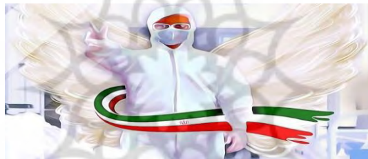
شکل ۲- تصویر مدافعان سلامت؛ فرشتگان زمینی؛ پایگاه خبری وزارت بهداشت ۹۹/۰۶/۰۴