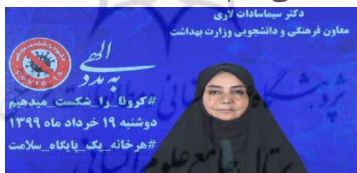
شکل ۱- شعار به مدد الهی کرونا را شکست می‌دهیم پشت سر سخنگوی وزارت بهداشت ایران