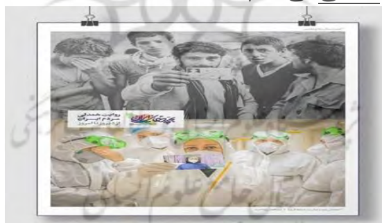
شکل ۳- روایت همدلی مردم ایران: پایگاه خبری وزارت بهداشت: ۹۹/۰۴/۳۱