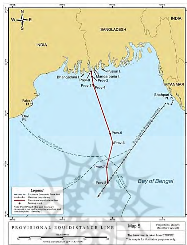
شکل شماره ۳: خط هم‌فاصله موقت، بنگلادش - هند