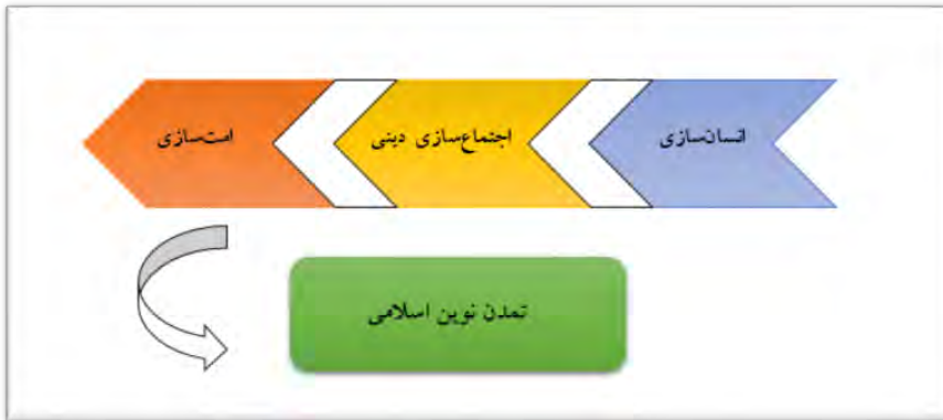
شکل (۴). مراحل تحقق تمدن نوین اسلامی از منظر تربیتی

تعریف کنیم که فضای مجازی در هر کدام از این مراحل می‌تواند اثرگذار باشد: