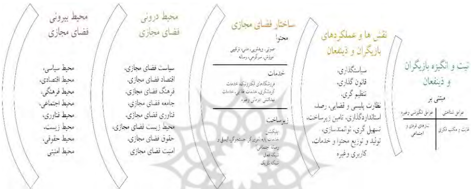
شکل (۲). مدل فضای مجازی

براساس ابعاد و مؤلفه‌های شناسایی شده، می‌توان مدلی مفهومی از فضای مجازی ارائه کرد: