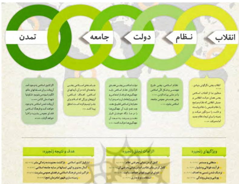
شکل (۳). مراحل پنج‌گانه تحقق تمدن نوین اسلامی از منظر مقام معظم رهبری

(وبسایت دفتر حفظ و نشر آثار آیت الله خامنه‌ای) ۱