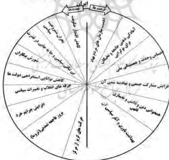
فرصت‌ها و تهدیدات سیاسی و امنیتی پسا‌کرونا در ایران

از بین رفتن مرجعیت‌ها در جامعه، کاهش شدید در طبقه متوسط یا از بین رفتن خودآگاهی در بین آنها، گسترش خشم و نفرت در جامعه و طولانی شدن این پاندمی و همزمانی آن با فشارهای بین‌المللی می‌تواند به مرحله سوم تروما یا فاجعه در تاریخ فعلی ایران تبدیل شود. در حال حاضر کرونا یک آنتروپی محیطی است که با پیچیدگی سیستمی باید آن را کنترل کرد، اما این آشوب مانند طاعون سیاه ممکن است به تروما تبدیل شود. در برابر آنتروپی‌های محیطی باید سیستمی وجود داشته باشد تا به تروما تبدیل نشود.