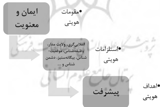
شکل ۲. الگوی هویتی جوانان از دید مقام معظم رهبری بر مبنای دفاع مقدس

کیست و برای چه می‌خواهد تلاش و کار کند» ۱ . هدف بر حسب مقولات بیانات مقام معظم رهبری، «پیشرفت» است که با ملاحظه مقوله محوری «ایمان و معنویت»، رشد و تعالی جوان ایرانی را در سطوح مختلف حیات فردی و اجتماعی خویش و آرمانهای نظام و انقلاب اسلامی مطرح نظر دارد. در این دیدگاه، آرمان انقلاب اسلامی و جمهوری اسلامی، رشد و تعالی مادی و معنوی انسان در قالب تحقق تمدن نوین اسلامی است: «آنچه ما تصور می‌کنیم که وظیفه ما است، وظیفه مجموعه مسئولان کشور است؛ وظیفه دولت جمهوری اسلامی است؛ این است که این سه مؤلفه بزرگ را برای همه تصمیم‌گیرها و همه اقدامها در نظر داشته باشد: مؤلفه اول آرمانها و اهداف نظام جمهوری اسلامی است که این اهداف و آرمانها مطلقاً نباید از نظر دور بشود که آرمان نظام جمهوری اسلامی را می‌شود در جمله کوتاه «ایجاد تمدن اسلامی» خلاصه کرد. تمدن اسلامی یعنی آن فضایی که انسان در آن فضا از لحاظ معنوی و از لحاظ مادی می‌تواند رشد کند و به غایات مطلوبی که خدای متعال او را برای آن غایات خلق کرده است برسد؛ زندگی خوبی داشته باشد؛ زندگی عزتمندی داشته باشد. انسان عزیز، انسان دارای قدرت، دارای اراده، دارای ابتکار، دارای سازندگی جهان طبیعت. تمدن اسلامی یعنی این. هدف نظام جمهوری اسلامی و آرمان نظام جمهوری اسلامی این است» ۲ .