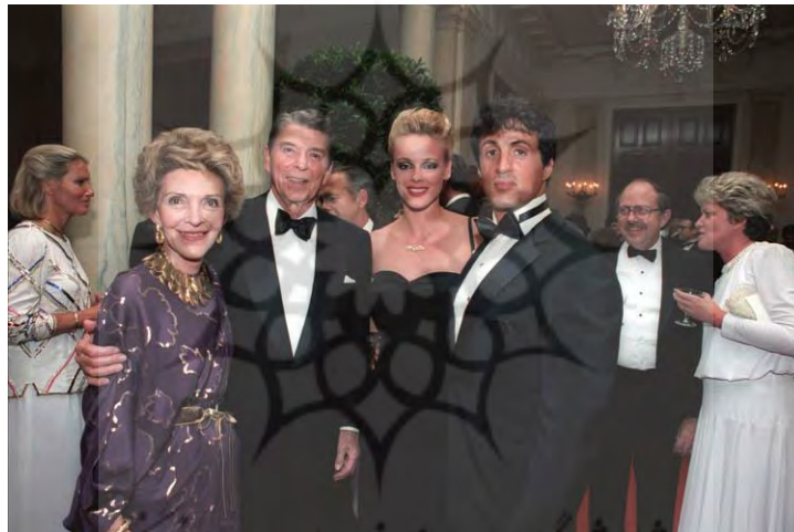
شکل ۱. سیلوستر استالونه به همراه بریتی نیلسن، ۱ رونالد ریگان و نانسی ریگان در کاخ سفید، سال ۱۹۸۵.

موفقیت فیلم رامبو که چند ماه پیش از چهارصد هزار دلار به فروش رفت، افزون بر خلاقیت هنری و قدرت اقتناع آن، به سبب حمایت‌های کاخ سفید نیز بود. رامبو نیز با بازنمایی فضاهای روسی، به مثابه مکان‌هایی سراسر تنش‌زا و بحران‌آفرین و با مردمانی بدون عقلانیت، اهریمنی و خشن، دوآلیسم ما و آن‌ها و ژئوپلیتیک تنش را در میان توده آمریکایی‌ها رواج داد. در همه این فیلم‌ها و به‌ویژه رامبو، گریزی جز «تنش همیشگی» وجود ندارد (Ross, 2011: 71).