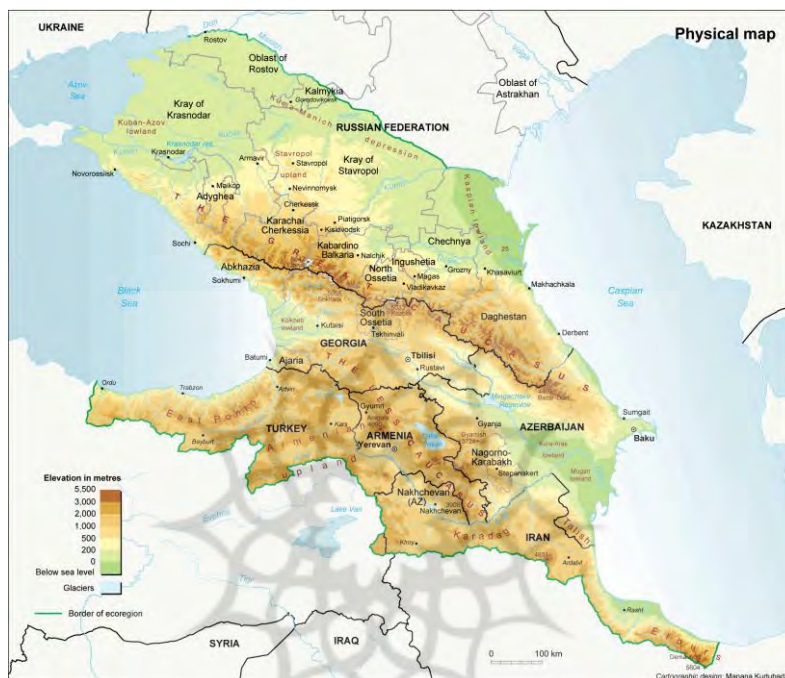
نقشه ۱. قفقاز جنوبی

مناطق آرام و خفته ژئوپلیتیک به شمار می‌آید، اینک با کشف منابع انرژی فعال‌شده و کشورهای آن به تدریج از انزوای جغرافیایی خارج شده و در پی ایفای نقشی مناسب در عرصه منطقه‌ای و بین‌المللی هستند (Bekiarova, 2019: 1017).