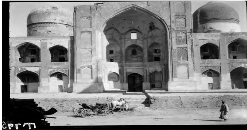
تصویر ۱. مدرسه میرعرب بخارا در سال ۱۳۴۲ق/ ۱۹۲۴م.