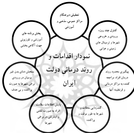
نمودار ۱. اقدامات و روند درمان کرونا در دولت ایران

این در حالی است که مدیریت بحران شاید سخت‌ترین آزمایش برای دولت‌ها باشد. این امر بویژه در مورد کووید ۱۹، از این رو صادق است که هیچ سابقه یا راه‌حل تاریخی قابل مقایسه‌ای ندارد و تهدید آن مدام در حال تحول است. فقط گذر زمان اثبات خواهد کرد که رهبران و مدیران جهان چقدر موفق عمل کرده‌اند و کدام استراتژی‌ها بهترین نتیجه را کسب کرده است، Glazer (2020). این درحالی است که اقدامات دولت سنگاپور تا این زمان روشمند، با برنامه و حاصل اتحاد مسئولان این کشور است. مطالعه شیوه عمل و کنش دولت سنگاپور نشان می‌دهد که با تشخیص به موقع، پایش صحیح و هدفمند