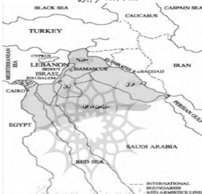
نقشه (۱) نقشه طرح بنون

قدرت جهانی». به عبارت دیگر، هدف شارون و نتانیاهو این است که بعد از فریب دادن همه جهانیان، آمریکایی‌ها را فریب دهد. همچنین جنگ انرژی بخش مهم راهبرد آمریکا، اسرائیل، عربستان و ترکیه علیه دولت اسد است (Blog, 2016, 205).