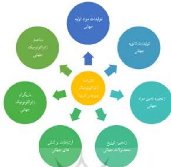
شکل ۱: مدل مفهومی تحقیق: تأثیرات ژئواکونومیک کرونا