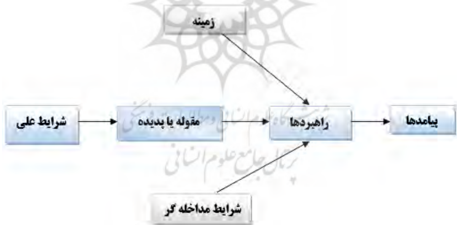
شکل ۱. ابعاد تئوری زمینه‌ای جهت بررسی ابعاد پژوهش بر اساس اهداف (محقق ساخته)

این پژوهش در این مرحله فاقد یک مدل مفهومی است. مدل مفهومی بیانگر ارتباط بین متغیرها در پژوهش است و در این مرحله چنین روابطی برای پژوهش مطرح نیست. برای کشف مولفه‌ها و تقسیم‌بندی آنها برای رسیدن به مدل نهایی رهبری هوشمند مبتنی بر قدرت نرم از تئوری داده‌بنیاد استفاده خواهد شد.