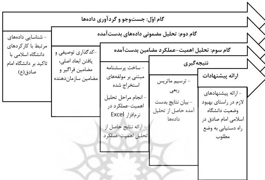
شکل ۲- فرآیند پژوهش

فرآیند این پژوهش پس از مرور مبانی نظری و پیشینه پژوهش، به‌طور خلاصه در قالب نمودار زیر بیان شده است.