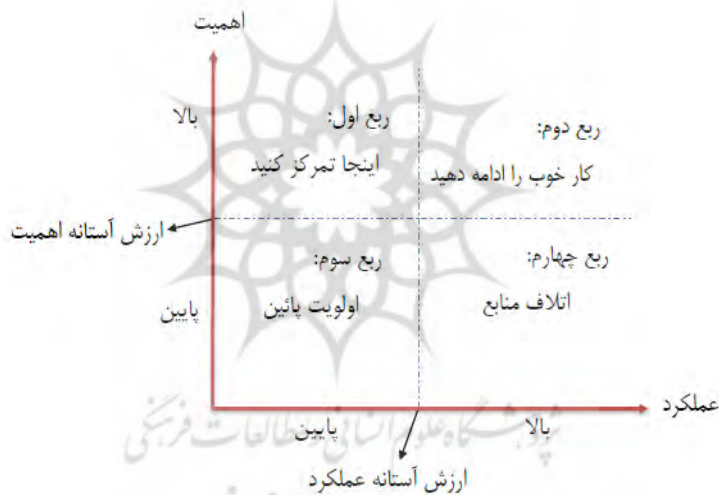
شکل ۱ - مدل ربعی تحلیل اهمیت-عملکرد (آذر و همکاران، ۱۳۹۵)

موضوع با استفاده از روش نخبگانی و پرسشنامه می‌تواند در شناخت و آسیب‌شناسی وضعیت موجود و ارائه راهبرد و راهکار مؤثر باشد. نقش این ماتریس که دارای چهار قسمت (یا چارک) است و در هر چارک، راهبرد خاصی قرار دارد، کمک به فرآیند تصمیم‌گیری است. در این مدل، از میانگین داده‌های مربوط به سطح عملکرد و میانگین داده‌های مربوط به درجه اهمیت هر یک از عوامل، برای تعیین مختصات هر شاخص و نمایش آن در ماتریس IP، استفاده می‌شود. به این ترتیب، با جفت شدن این دو مجموعه از مقادیر، هر یک از عوامل در یکی از چهار ربع ماتریس IP قرار می‌گیرند (Hisham & Ainin, 2008 p.100). ناحیه اول (ناحیه توجه حیاتی): پاسخ‌دهندگان، عوامل را از نظر اهمیت بسیار بالا ارزیابی می‌کنند، ولی سطح عملکرد این عوامل به نسبت پایین است. بنابراین باید تلاش‌های بهبود و توسعه را در این ناحیه متمرکز کرد.