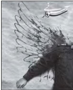
تصویر ۱۱: ایجاز تصویری و القای مفهوم شهادت (نهضت مردمی پوستر انقلاب، ۱۳۹۸/۱۰/۱۷)

عظوفت و مهربانی در کنار سایر ویژگی‌های شخصیتی ایشان، مانند: ولایت‌مداری، اقتدار، ایمان و جهاد از مشخصه‌های شخصیتی