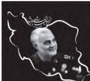
تصویر ۱۴: القای مفهوم اندوه مردم ایران از طریق استعاره تصویری. (نهضت مردمی پوستر انقلاب، ۱۳۹۸/۱۰/۱۷)

ناگفته پیداست که با شهادت سردار سلیمانی اندوه از دست دادن قهرمان مبارز پیروزمند بر قلب‌های مردم ایران جاری شد، هرچند شهادت آرزوی سردار بود؛ اما غم جدایی از سردار عزیز، بخشی از تاریخ شفاهی ملت ایران خواهد بود. نکته‌ای که امام خامنه‌ای به خوبی به آن اشاره کرده‌اند. عبارت «ایران شود عزادار تو ای سردار مملکت» در برخی پوسترها نیز همین مفهوم را بیان می‌دارد.