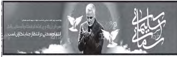
تصویر ۱۰: ویژگی‌های شخصیتی سردار سلیمانی، نیایش و عبادت، کاربرد نمادهای نور، کبوتر (طرح دات آی آر، ۱۳۹۸/۱۰/۱۸)