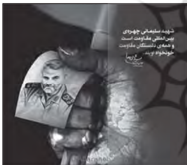
تصویر ۴: مفهوم ایستادگی و مقام، مفهوم استعاری نشانه‌های دست و پرچم قرمز. (خبرگزاری اس.ان.ان، ۱۴/۱۰/۱۳۹۸)

گفتنی است ایستادگی در برابر ظلم و مقاومت بخشی از فرهنگ ایران و اسلام است که مرجع ظهور