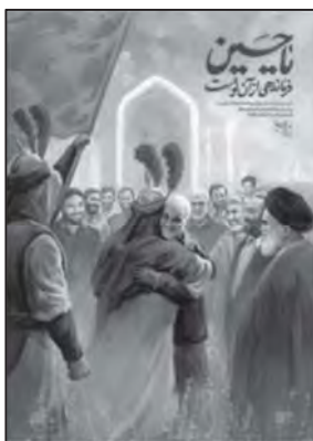
تصویر ۱۲: پیوستن شهید سلیمانی به ارواح طیبه شهدا

است (تصویر ۱۱) که عبارت است از حذف جزئیات تا حد مبانی ضروری است. (استینسون، ۱۳۹۰: ۹۹)