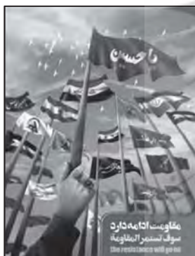
تصویر ۱۵: سردار سلیمانی چهره بین‌المللی مقاومت (نهضت مردمی پوستر انقلاب، ۱۳۹۸/۱۰/۱۷)

یکی دیگر از ویژگی‌های شخصیتی سردار سلیمانی، حضور تأثیرگذار و هدایت‌بخش در مقاومت کشورهای اسلامی است. در پوستر شماره ۱۵ پرچم اصلی «یا حسین» در دستی با انگشتر، نماد حاج قاسم سلیمانی است و تلویحا نمادهای تصویری خبر از تداوم قیام امام حسین (ع) در عصر حاضر دارد؛ زیرا پرچم «یا حسین» در دست سردار است.