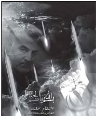
تصویر ۲: مفهوم انتقام سخت در پوستر سردار سلیمانی. (خبرگزاری اهل‌بیت، ۱۳۹۸/۱۰/۲۳)

تئوری‌های شناخته‌شده مفاهیم نمادین رنگ و نیز روان‌شناسی رنگ در نظریه لوشر، ۱ رنگ قرمز را محرک اراده برای پیروزی و اشکالی از نیروی زندگی، قدرت و توانایی بیان می‌کند. از نظر لوشر رنگ قرمز رویارویی با اراده یا قدرت اراده را بیان می‌کند و از نظر سمبلیک مانند خونی است که به هنگام فتح پیروزی ریخته می‌شود. (لوشر، ۱۳۷۰: ۸۴) (تصویر ۱)