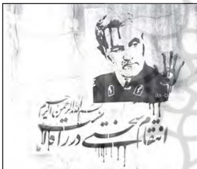
تصویر ۱: مفهوم انتقام در پوستر سردار سلیمانی

با رفتن سردار شهید قاسم سلیمانی ... انتقام سختی در انتظار جنایتکارانی است که دست پلید خود را به خون او آلودند. (پایگاه اطلاع‌رسانی دفتر مقام معظم رهبری، ۱۳/۱۰/۹۸)