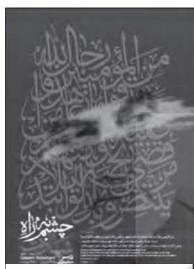
تصویر ۱۳: وفای به عهد و شهادت در راه خدا مفهوم پوستر.

یکی از ویژگی‌های شهید سردار سلیمانی، شوق و اشتیاق برای شهادت و پیوستن به ارواح شهدا بود. موضوعی که جمله اول پیام امام خامنه‌ای درباره ایشان است: «دیشب ارواح طیبه شهیدان، روح مطهر قاسم سلیمانی را در آغوش گرفتند.» پوستر شماره ۱۲، سردار سلیمانی را در میان حلقه‌ای شادمان از شهیدان و رستگاران راه خدا نشان می‌دهد که در پلان اول تصویر و در صدر حلقه، امام حسین علیه السلام ، حضرت ابوالفضل علیه السلام و امام راحل علیه السلام قرار گرفته است.