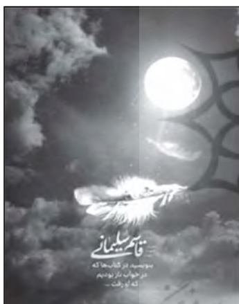
تصویر ۹: تداعی حس امنیت از طریق نشانه‌های استعاری. (خبرگزاری اهل بیت، ۱۳۹۸/۱۰/۲۳)

برخی از پوسترها حس امنیت و آسایش مردم را در سایه اقتدار سردار سلیمانی بیان می‌دارند و اندوه