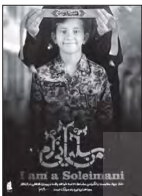
تصویر ۱۶: القای مفهوم تداوم راه قاسم سلیمانی از طریق تصویر و نوشتار (نهضت مردمی پوستر انقلاب، ۱۳۹۸/۱۰/۱۷)

یکی از عمیق‌ترین معانی پوسترها و بیلборدهای حاج قاسم سلیمانی، تداوم راه اوست. پیام‌هایی همچون «حاج قاسم زنده است، من سلیمانی‌ام، سلیمانی‌ها در راهند» در این پوسترها به چشم می‌خورد. پوسترها این پیام رهبری را به مخاطب منتقل می‌کنند که خط جهاد مقاومت با انگیزه مضاعف ادامه خواهد یافت.