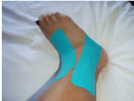
شکل ۱. تیپ کینزیو در مچ پا