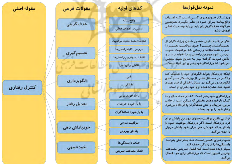
شکل ۱- فرآیند ظهور مقوله کنترل رفتاری

کدگذاری انتخابی به انتخاب یکی از مقولات به عنوان مقوله اصلی اشاره دارد و سایر مقولات ظهور یافته ممکن است از ویژگی‌های مقوله اصلی باشد و یا با آن مرتبط باشند. در این مرحله کدگذاری صرفاً برای مقوله اصلی و مقوله‌های مرتبط آن صورت می‌گیرد و نمونه‌گیری‌های بعدی با هدف توسعه نظریه صورت می‌گیرد. کدگذاری انتخابی تا زمانی ادامه می‌یابد که مقوله اصلی و مقولات مرتبط با آن اشباع شوند. شکل شماره ۱ فرآیند ظهور مقوله اصلی یعنی کنترل رفتاری را نشان می‌دهد که خود شامل چندین مقوله فرعی و کدهای اولیه است.