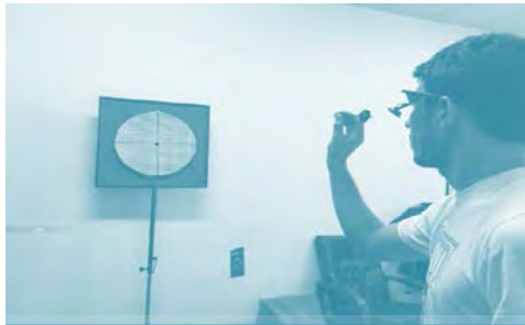
شکل ۱. نحوه ارزیابی خیرگی و حرکتی پرتاب دارت

شامل ۲ کانون توجه (بیرونی و درونی) در ۲ بار تکلیف ثانویه (برآورد و عدم برآورد تن صدا) بود. هر شرایط شامل ۱۸ کوشش در قالب ۶ بلوک ۳ کوششی بود. شایان ذکر است بعد از هر سه کوشش پرتاب دارت آزمونگر دارت‌ها را بازیابی می‌کرد و کالیبراسیون دستگاه بررسی شد. بین هر بلوک ۳۰ ثانیه و بین هر شرایط نیز ۲ دقیقه استراحت داده شد که در این زمان نیز دستورالعمل‌های توجهی ارائه می‌شد.