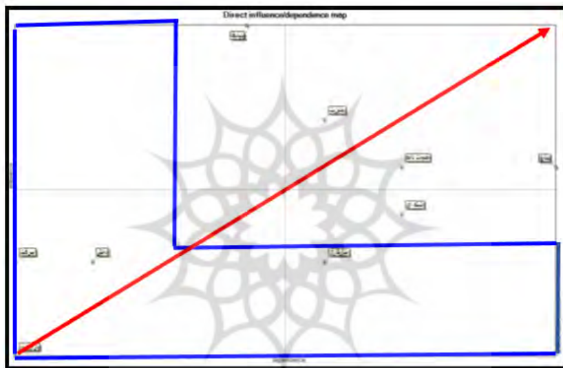
نمودار ۲. پراکنندگی عوامل زیرساخت فناوری اطلاعات

در تحلیل پلان براساس پراکنش متغیرها دو سیستم پایدار و ناپایدار وجود دارد که در سیستم پایدار پراکنش به صورت L انگلیسی نشان داده می‌شود، به این معنی که متغیرها تأثیرگذاری و تأثیرپذیری بالایی دارند. نمودار ۲ نشان‌دهنده وضعیت پراکنش متغیرهاست.