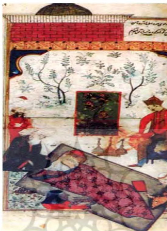
موضوع نگاره: بیماری اعصاب و روان و درمان با دعا (نسخه مصور بودلیان: ۱۷۴)

تاریخ‌نگری و تاریخ‌نگاری، سال ۳۰، شماره ۲۵، بهار و تابستان ۱۳۹۹ / ۲۹۱