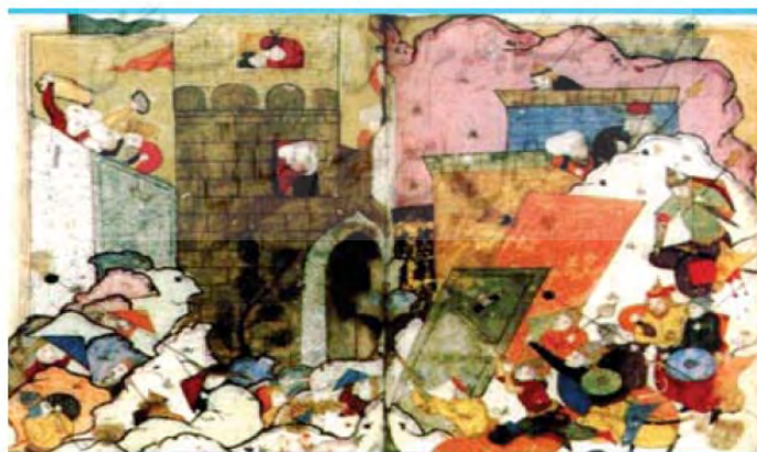
موضوع نگاره: محاصره قلعه بدلیس از سوی آق‌قویونلوها (نسخه مصور بودلیان: ۱۷۹)