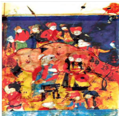
موضوع نگاره: امیر شرف‌خان بدلیسی در دوران جوانی (نسخه مصور بودلیان: ۱۸۷)