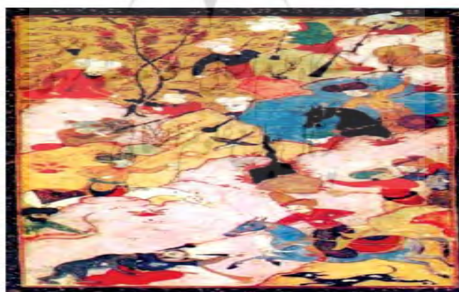
موضوع نگاره: صحنه شکار (عبدالرقيب يوسف: ۱۰۲)