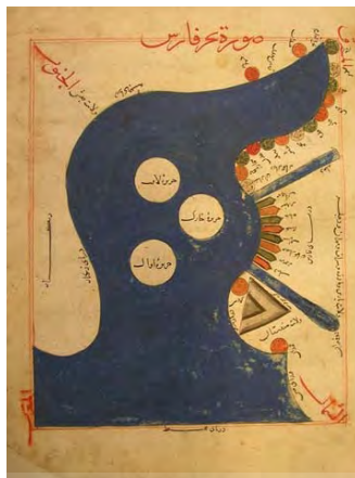
«نقشه خلیج فارس در کتاب اصطخری»