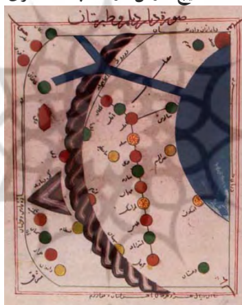
«نقشه دیلم و طبرستان در کتاب اصطخری»

در این نقشه‌ها، برخلاف نقشه‌های امروزی، شمال در پایین، جنوب در بالا و مشرق و مغرب به جای هم ترسیم می‌شد. اصطخری، نقشه را «صورت» نامیده و درباره اهمیت درج آن می‌نویسد: «ما صورت خراسان و شهرها و راه‌ها و بیابان‌ها و کوه‌ها، همه [را] نگاشتیم تا چون در شکل صورت نگرند، چنان نماید که خراسان در پیش نهاده است.» (اصطخری، ۱۳۴۰: ۲۰۳) برخی معتقدند این نقشه‌ها از کتاب ابن بلخی رونویسی شده و تغییری در آنها داده نشده است. (کراچکوفسکی، ۱۳۷۹: ۱۵۶) به‌جز اصطخری، ابن حوقل و مقدسی که هر دو از جغرافی دانان مکتب بلخی به‌شمار می‌روند، از نقشه استفاده کرده‌اند. بنابراین بهره‌گیری از نقشه را می‌توان جزو ویژگی‌های این مکتب برشمرد.