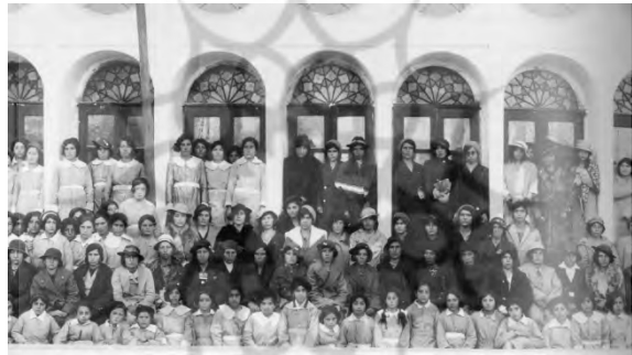
جشن مدرسه‌ی دختران، اصفهان، ۱۹۳۶م.