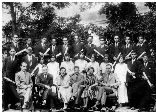
یکی از مدارس کلیمیان بعد از کشف حجاب، محل نگهداری: مرکز اسناد همدان، شماره‌ی بازیابی: