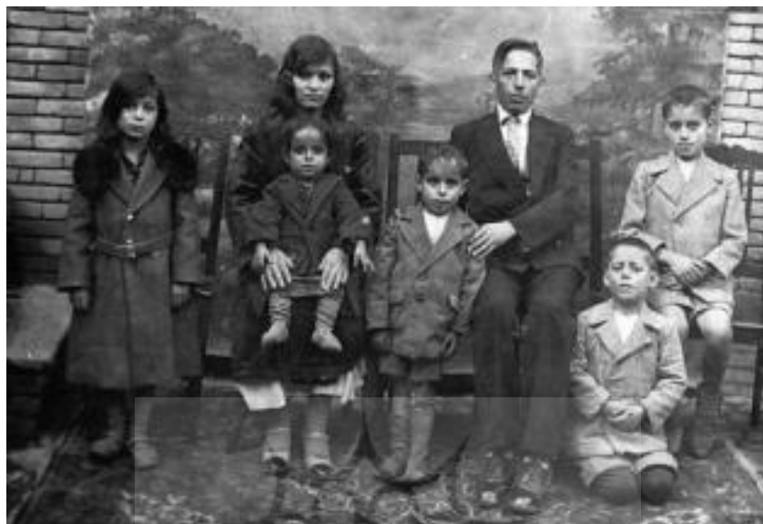
خانواده راسک، همدان، ۱۹۲۷

تأثیر اقدامات رضاشاه در وضعیت اجتماعی، اقتصادی و فرهنگی کلیمیان | ۱۳۱