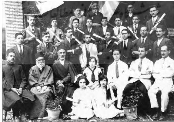
دانش‌آموزان، معلمان و مدیران مدرسه، همدان، ۱۹۲۷م.