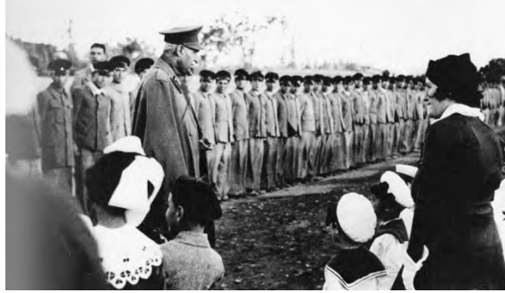
رضاشاه و دیدار دانش‌آموزان و معلمان مدرسه آلیانس همدان، ۱۹۳۶م.