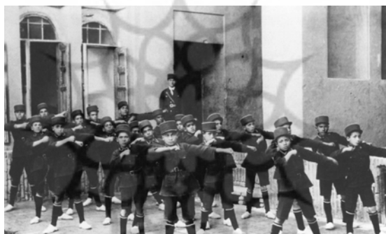
دانش آموزان یهودی با لباس فرم و کلاه پهلوی، یزد، ۱۹۳۱م.