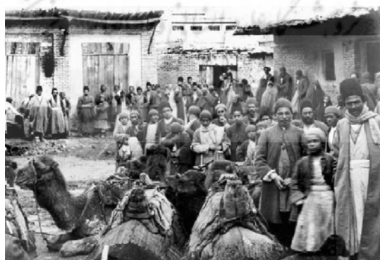
محلله‌ی قدیمی کلیمیان تهران در سال‌های آغازین پهلوی اول