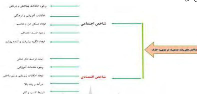
نمودار شماره ۱: شاخص‌های رشد جمعیت در جزیره خارک

شرکت)، سیار (مانند؛ دست‌فروشان و ... )، بلندمدت (برخی کارکنان صنعت نفت، ادارات، نیروی دریایی و ساکنینی که قصد ماندن در جزیره را داشتند) و مقیم (اهالی بومی جزیره) تشکیل می‌شد.