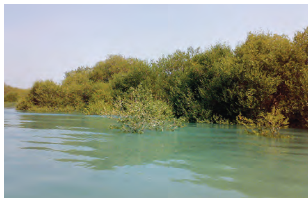
جنگل حرا. یکی از سایتهای گردشگری ژئو پارک قشم؛ عکس از: افسانه احسانی و نیما آذری

از آنجایی که گردشگری، یک صنعت و فرهنگ تأثیرگذار و تأثیرپذیر بشمار می‌آید، میتواند تفاهمی را بین افراد و فرهنگها