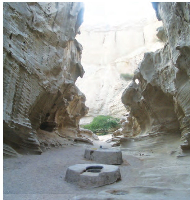
تنگه چاهکوه. یکی از سایتهای گردشگری ژئوپارک قشم؛ عکس از: افسانه احسانی و نیما آذری

اما متأسفانه بیشتر بومیان منطقه قشم؛ حتی آن کسانی که در مجاورت سایتهای طبیعی ثبت شده از طرف یونسکو زندگی میکنند، هیچ شناختی نسبت به وجود چنین سایتهایی ندارند؛ اما طبق یافته‌های این تحقیق، آگاهی بومیان، بدنبال آشنایی با این گردشگران، نسبت به جاذبه‌های طبیعی قشم افزایش پیدا کرده است؛ بعنوان نمونه، ابراهیم، راننده بومی منطقه معتقد است: