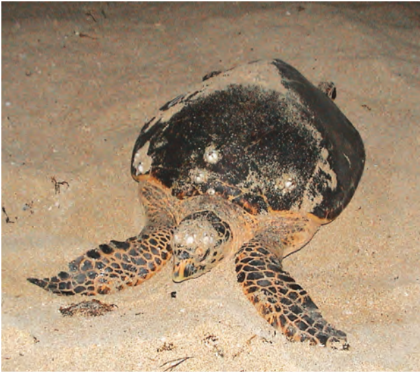
لاک پشت پوزه عقابی؛ زیستگاه: ژئوپارک قشم؛ عکس از: افسانه احسانی و نیما آذری

نزدیکی دره ستاره‌ها را به دو گروه سی نفری تقسیم کرد و از آنها خواست با تولید صنایع دستی بومی و غذاهای سنتی، قسمتی از پروژه حمایت و حفاظت از لاک‌پشته‌های پوزه‌عقابی را پوشش دهند. فرهنگ بومی این منطقه بگونه‌ی نیست که اجازه دهد، زنان این جزیره در شهرستانهای دیگر، آثار خود را بفروشند. بنابراین قرار شد، بخش برنامه توسعه سازمان ملل، راه شناسایی بازار، ورود به آن و تولید انواع آثار را به ما یاد دهد تا پس از آشنایی کامل، دیگر در شهرستانها با مشکل فروش مواجه نشویم و از سود این کار از لاک‌پشته‌های جزیره حفاظت کنیم.