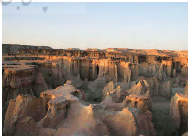
دره ستاره‌ها. یکی دیگر از سایتهای گردشگری ژئو پارک قشم؛ عکس از: افسانه احسانی و نیما آذری