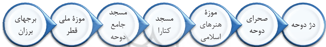
شکل شماره ۲: مهمترین جاذبه‌های گردشگری قطر (www.alamto.com)

کشور امیرنشین قطر با طول ۱۶۰ کیلومتر و عرض ۵۵ تا نود کیلومتر و مساحتی بالغ بر ۱۱/۴۴۰ کیلومتر مربع، بشکل شبه جزیره‌یی در خلیج فارس واقع شده است. این کشور از جنوب در جمع شصت کیلومترمربع با کشور عربستان مرز مشترک خاکی دارد. این کشور دارای شرایط آب‌وهوایی نیمه‌بیابانی با تابستانهای بسیار گرم و مرطوب است، بصورتی که درجه حرارت آن تا بیش از ۴۶ درجه میرسد. مهمترین جاذبه‌های گردشگری قطر در شکل شماره ۲ آمده است: