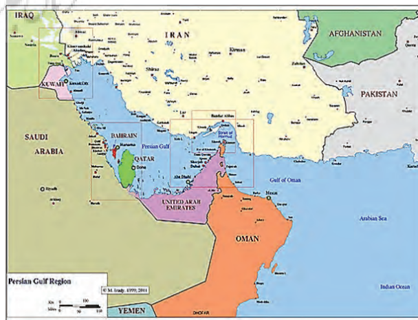
نقشه شماره ۱: منطقه خلیج فارس (www.gulf2000.columbia.edu)

ویژگی جغرافیایی و ژئوپولیتیکی ایران در ساخت اندیشه حکومت، چنان اهمیتی دارد که بناگزی بر تمامی جنبه‌های سازمان اجتماعی ایران و روانشناسی اجتماعی مردم تأثیری عظیم بر جای می‌گذارد. کیفیت فلات ایران بین دو حوضه گرم‌وخشک عربستان سعودی و سردوخشک روسیه قرار دارد، زمینه ژئوپولیتیک گذرگاهی را تقویت نموده و در کل،