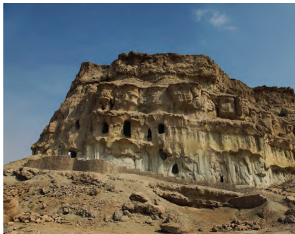
تصویر شماره ۱: نمای بیرونی غار خریس

شواهد تاریخی بر این امر دلالت دارد که با روی کار آمدن هخامنشیان و توسعه قدرت آنان، لزوم توجه به تجارت دریایی و بویژه سواحل و بنادر خلیج فارس، بیش از پیش مطرح شد. اقدامات کوروش، داریوش و خشایارشا، در ایجاد امنیت در نواحی ساحلی و تسهیل مراودات اقتصادی بین سواحل نیز موجب آبادانی و رونق این مناطق شد (وثوقی، ۱۳۸۹: ۲۸). علاوه بر آثار و شواهد باستان‌شناختی که از این دوره در جزیره قشم بدست آمده است (سال، ۱۳۸۸: ۱۸۸)، منابع مکتوب نیز اشاراتی به وجود تمدن و حضور جوامع انسانی در این جزیره داشته‌اند. پدر تاریخ، هرودوت، در کتاب سوم در مبحث عایدات شاهی بیان میکند که داریوش برای تمامی اقوام و طوایف مالیات مقرر داشت و نواحی همجوار را از جهت حسن جریان اداری تابع مرکزی واحد ساخت و اتباع شاه از جهت عایدات و مخارج، محض تسهیل کار، جزء این یا آن ساتراپی شده بودند. در زیر مجموعه ساتراپی چهاردهم، ساگارتیان، زرنگیان (سیستان)، تمانیان، اوتیانها، میسیها و سکنه جزایر خلیج فارس که شاه نفرت زندانی و آوارگان جنگی را به آنجا تبعید میکرد، حضور داشتند (هرودوت، ۱۳۶۸: ۲۲۴). ایالت چهاردهمی که هرودوت توصیف میکند، ظاهراً مشتمل بر ساحل دو سوی خلیج فارس بوده است. هرودوت در جایی دیگر نیز به جزیره‌نشینان دریای «اریتره» که به ارتش خشایارشا پیوسته بودند، اشاره میکند: «اینان که در جزایری زندگی میکنند که شاه بزرگ کسانی