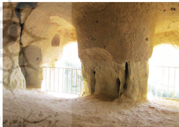
تصویر شماره ۳: درجه‌های نورگیر تالار اصلی

سیرکولاسیون ۱ حرکتی در معابد مهری از الگوی خطی پیروی میکند، پس از ورود به پیش‌تالار، حرکت به سوی تالار هدایت میشود و سیر حرکتی به فضای اصلی در انتهای محور طولی مجموعه پایان می‌پذیرد. حرکت به سمت فضاهای جانبی نیز از طریق پیش‌تالار میسر است (همان: ۱۰۴). در غار خربس نیز پس از راهروی ورودی پیش‌تالار قرار دارد و از طریق این پیش‌تالار، وارد تالار اصلی میشویم (نقشه شماره ۱). از نظر سلسله‌مراتب فضایی در معابد مهری، انتهایی‌ترین فضا که همان جایگاه مقدس است یک یا چند پله از فضای قبلی ارتفاع مییابد که دارای بیشترین تزئینات و از سقف مرتفع‌تری برخوردار است و نورگیری بیشتری هم دارد (همانجا). در غار خربس تالار اصلی که با چهارده پله از پیش‌تالار جدا میشود، دارای سقفی بلند به ارتفاع ۲/۵۰ است و درجه‌های بیشتری برای نورگیری دارد (تصویر شماره ۳).