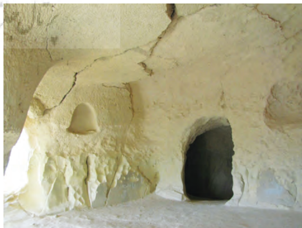
تصویر شماره ۲: نمای درونی تالار اصلی غار، رفه‌هایی با قوس بیضی

راه ورودی به تالار، راهروی تنگ و کوتاه دالانمانندی است که به یک سربالایی تند میرسد که بوسیله چهارده پله‌یی که جدیداً تعبیه شده است، وصول به تالاری بشکل مربع مستطیل در بالای سربالایی که مساحت آن ۵/۱۵ \times ۵/۳۰ متر و با ارتفاع حدود ۲/۵۰ متر است، ممکن میشود. در میان ضلع شرقی تالار یک ستون سنگی وجود دارد. در سوی راست تالار، اتاقکی با سقف گهواره‌یی شکل و در چپ آن اتاقکی بسیار کوچک‌کنده شده است. نشانه‌هایی از هنر تیشه‌کاری سنگ‌تراشان کهن، هنوز بر روی سقف و بخشی از دیواره‌های جانبی تالار و تنها ستون سنگی تالار بجا مانده است (بلوکباشی، ۱۳۷۹: ۳۲). در دیواره‌های جانبی تالار رفه‌هایی با قوسه‌هایی بیضی‌کنده‌اند (تصویر شماره ۲).