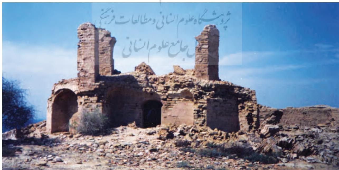
دژ پرتقالیها، چابهار

دارا بودن چنین جایگاه پیوندی که پیونددهنده شمال به