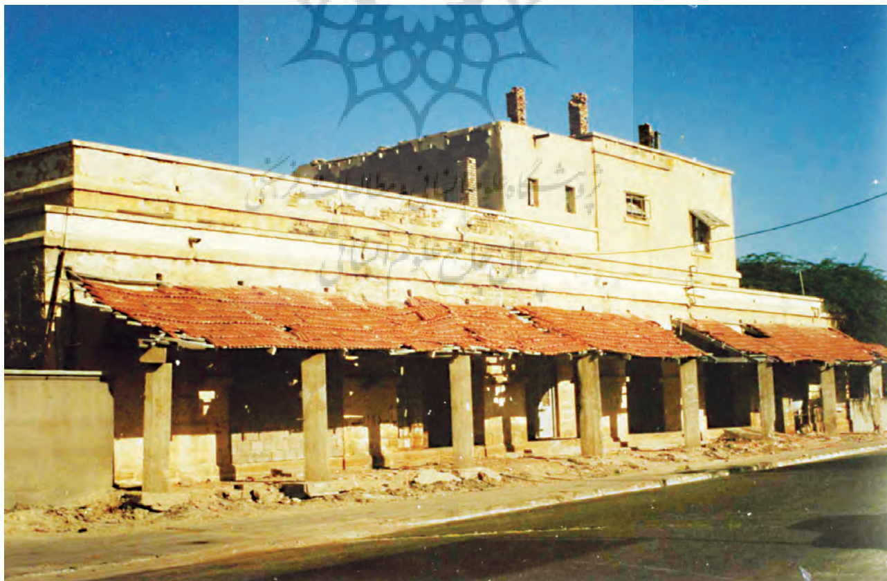
ساختمان کمپانی هند شرقی، چابهار

شهر مرزی چابهار به انگیزه چیرگی بر اقیانوس هند و دریای مکران و نیز جایگاه فیزیکی ویژه خود، دارای ارزش استراتژیک است و همچنین قرارگرفتن این شهر در آغاز راههای زمینی و در جای برخورد ابرقدرتها از دیرباز جایگاه سیاسی و نظامی ویژه‌یی را بدست آورده است (افشار سیستانی، ۱۳۷۲: ۷۰-۷۱). از آنجا که شهر چابهار در نزدیکی «مدار رأس السرطان» و منطقه استوایی قرار گرفته است، دگرگونیهای گرما در فصلهای گوناگون در آن اندک