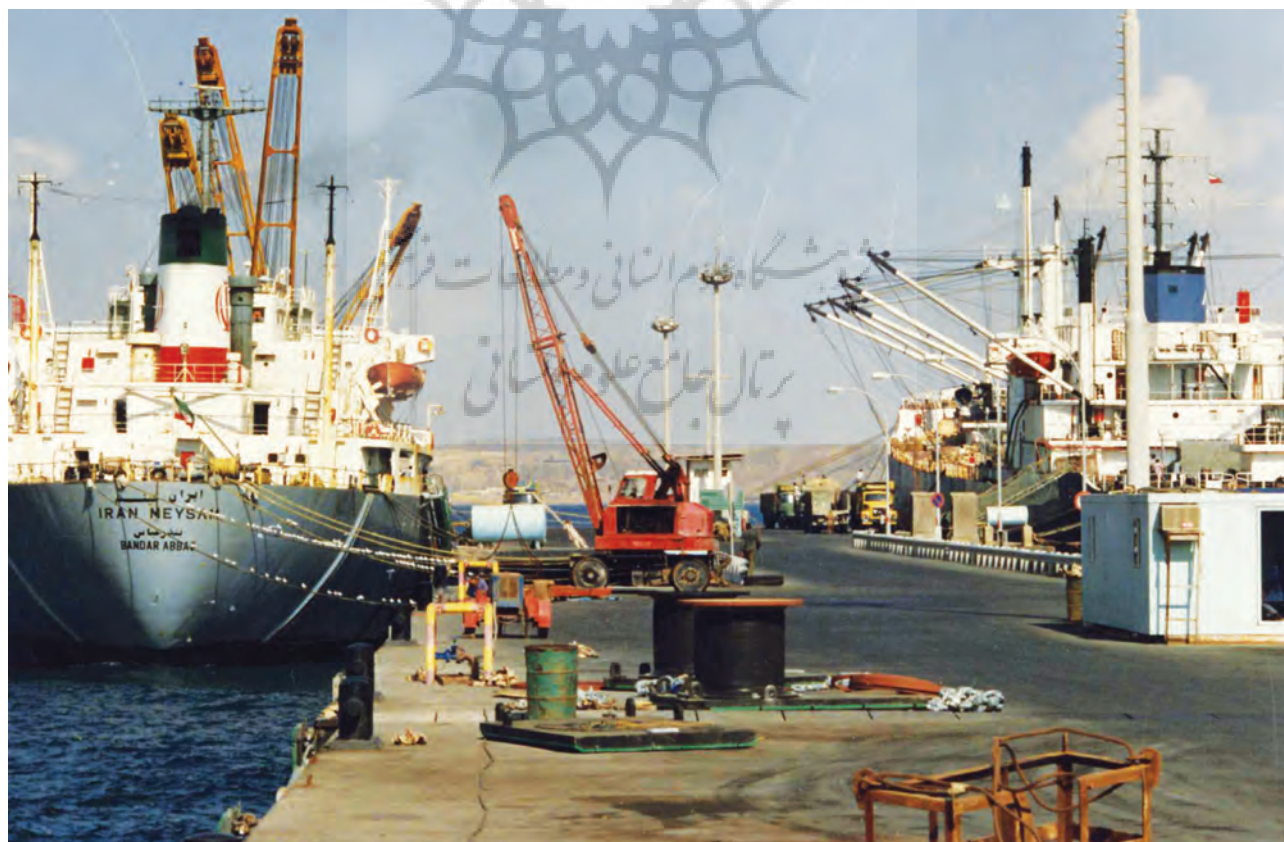
اسکله بندر شهید بهشتی، چابهار؛ مأخذ: آرشیو دکتر ایرج افشار سیستانی

اسکله شهید بهشتی نیز در حال کامل شدن است. با نگرش به قراردادهایی که با قرارگاه خاتم‌الانبیا بسته شده است، اسکله شهید بهشتی با توانایی پهلوگیری کشتیهای اقیانوس‌پیما و بزرگ کانتینری کامل خواهد شد. همچنین با نگرش به قرارگرفتن منطقه آزاد چابهار، در گذرگاه ترانزیت هوایی، مصوبه ساختن فرودگاه بین‌المللی چابهار در آبان ۱۳۸۹ از سوی دولت تصویب شده و منطقه آزاد چابهار تعهد نموده در پیمایش چند ساله، فرودگاه را بسازد. بنابراین چابهار در آینده نزدیک بهترین گذرگاه برای ترانزیت مسافر و کالا خواهد بود. با ایجاد راه آهن چابهار- مشهد و چابهار-