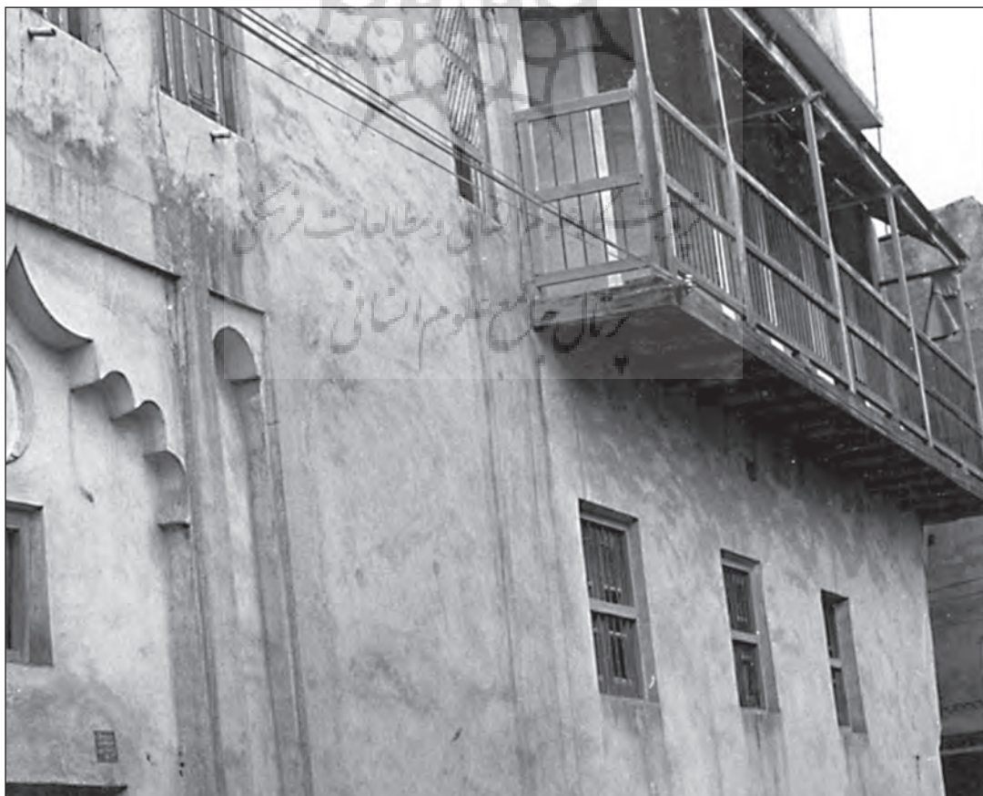
عمارت شهبندری عثمانی در بندر بوشهر