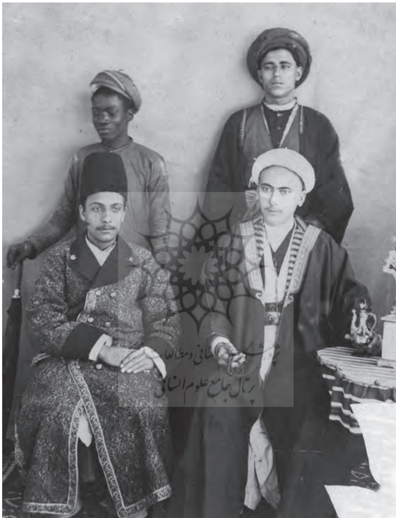
کارکنان شهبندری عثمانی در بندر بوشهر