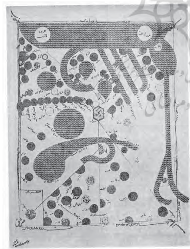
صورت بحر فارس؛ مأخذ: (سمینار خلیج فارس، ۱۳۴۲: ۱/۱۸۷).