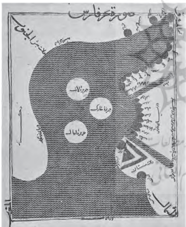
دریای پارس؛ مأخذ: (سمینار خلیج فارس، ۱۳۴۲: ۱/۱۸۹).