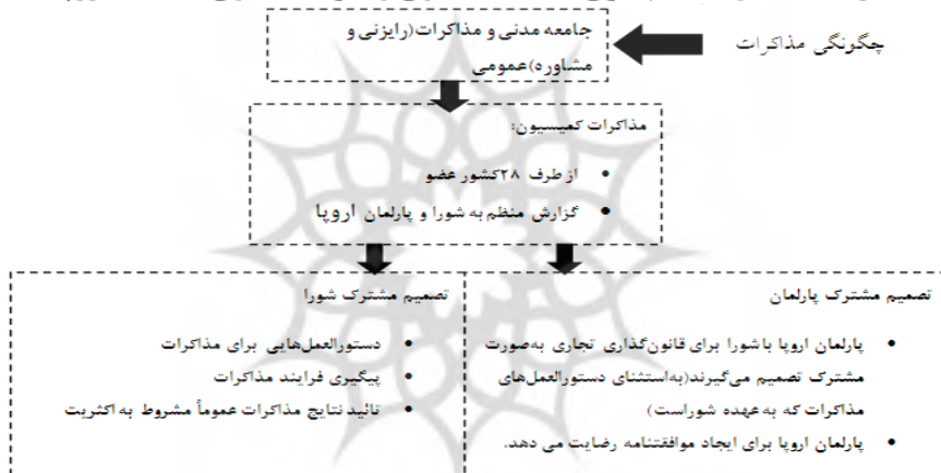
شکل ۱: ساختار تصمیم‌گیری سیاست تجاری و سرمایه‌گذاری اتحادیه اروپا

هدف مرحله سوم این است که یک اقدام توسط دو نهاد همراه با یک متن مشترک که در آن پارلمان با رأی‌گیری اکثریتی و شورا با اکثریت کیفی عمل می‌کنند، اتخاذ شود. این رویه کامل باید محدودیت‌های زمانی مختلف را در نظر بگیرد. بدین ترتیب، همان‌طور که گفته شد تا شروع مرحله سوم تقریباً موافقت پارلمان و شورا بر روی یک متن انجام می‌شود و در مرحله سوم با رأی‌گیری این دو نهاد، پیشنهاد مطرح‌شده به‌وسیله کمیسیون به قانون تبدیل می‌شود (GSTÖHL, 2013: 14).