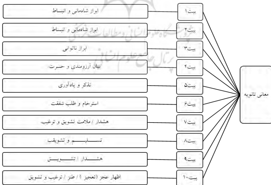
جدول شماره ۴- نقش معانی ثانویه در ایجاد ارتباط موثر

«انتقال مطلوب و موثر هم، زمانی صورت می‌گیرد که گوینده و شنونده برای انتقال مفاهیم و نیت خود از تعبیرات مناسب و آشنایی در زمینه موضوع مورد انتقال بهره گیرند». (یارمحمدی، ۱۳۹۱: ۱۲۱) «رابطه خوب، همان چیزی است که ما از آن به ارتباط موثر تعبیر کرده‌ایم. هر چه تفاوت در نیت گوینده و شنونده کمتر باشد؛ ارتباط موثرتر خواهد بود». (همان: ۱۳۸). سعدی از طریق تولید مفاهیمی همچون تشویق و ترغیب، بیان آرزومندی و اشتیاق، ابراز ناتوانی، تذکر و یادآوری و... در ساختار بیانی غزل و از طریق خلق معانی ثانویه به ایجاد ارتباط موثر در متن اقدام کرده است؛ با توجه به اینکه در ایجاد ارتباط موثر هر چه تفاوت میان مقصود گوینده و شنونده کمتر باشد، رابطه بهتر و تاثیر گذارتری ایجاد خواهد شد، سعدی در این غزل به معانی ثانویه‌ای پرداخته است که با تجارب زیسته و تاریخی _ فرهنگی مخاطب ایرانی هم سمت و سو و موازی است.