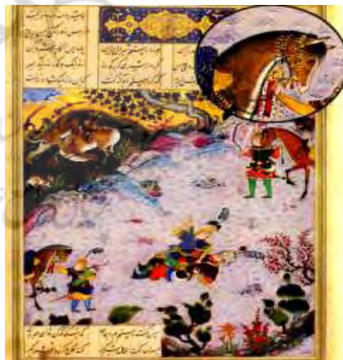
شکل (۴) «نگاره کشتی گرفتن رستم و سهراب» (رجبی، ۱۳۹۲: ۱۷۵). (مشاهده طبل باز، کنار زین اسب سهراب).