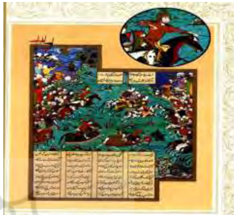
شکل (۲) «نگاره کشته‌شدن بارمان به دست قارن» (شاهنامه شاه طهماسب، ۱۳۶۹: ۲۵). (مشاهده طبل باز، کنار زین اسب یکی از لشکریان قارن).