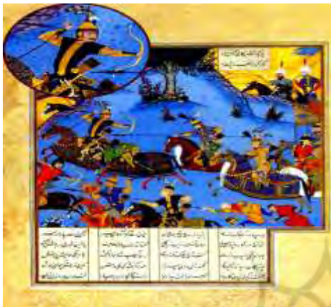
شکل (۳) «نگاره رزم بهرام چوبینه با ساوه‌شاه» (رجبی، ۱۳۹۲: ۳۸۹). (مشاهده طبل باز، کنار زین اسب یکی از لشکریان ساوه‌شاه).

مربوط به صحنه‌های رزم در شاهنامه است، طبل باز را در کنار زین اسب رزم‌آوران و مبارزان مشاهده می‌کنیم. در ادامه به چند نمونه از این نگاره‌ها استناد می‌شود.