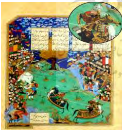
شکل (۵) «نگاره رزم رستم با کاموس» (رجبی، ۱۳۹۲: ۲۷۳). (مشاهده طبل باز، کنار زین اسب رستم).