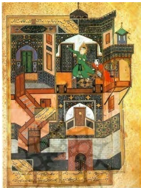
(تصویر ۱) بهزاد، گریز یوسف، هرات ۸۹۵. قاهره، کتابخانه ملی مصر، این نقش از کتاب باغ های خیال م.ا. کور کیان - ژ.پ. سیکر ترجمه،

مثلاً رنگ سرخ همه جا نماد عشق زمینی نیست؛ بلکه در جایی نماد قوت سلوک است.