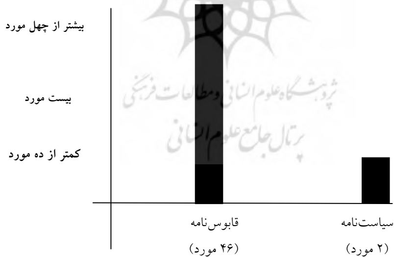
نمودار (۲): توصیه‌های مربوط به اخلاق فردی