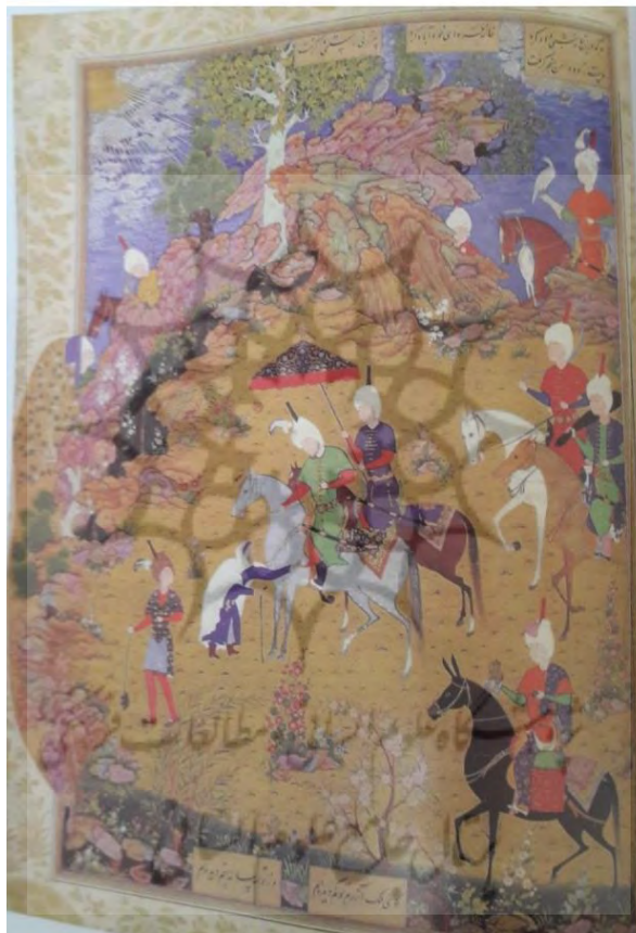
تصویر ۳: نگاره پیرزن و سنجر، دوره صفویه، مکتب تبریز، قرن دهم هجری (منبع: کنبای، ۱۳۸۱: ۸۰).

بنابراین دیده می‌بینیم که کاربرد اسامی افلاک مانند: ماه، خورشید، خاک، باد و آتش در همه منظومه‌ها قابل مشاهده است. گاهی لازم است از معشوق صحبت کند او را همانند ماه شب چهارده زیبا ترسیم می‌کند و یا همانند خورشید تابان که به زندگی عاشق نور و روشنایی می‌بخشد. اگر قرار است از عاشق صحبت شود آن را خاکی و زمینی می‌داند و یا همانند آتش سوزان در فراق یار. به نوعی عاشق زمینی (خاکی و آتشین) و معشوق آسمانی (ماه و خورشید) است و عنصر باد به عنوان پیام‌رسان بین این دو ایفای نقش می‌کند. در خمسه شاه طهماسبی نیز در نگاره‌ها هنرمندان کوشیده‌اند تا در تصویرپردازی‌های خود از اجرام آسمانی استفاده کنند. همان‌گونه که در تصویر شماره (۲) دیده می‌شود خورشید تبدیل به یکی از محوری‌ترین اجزاء در ترسیم این نگاره شده است.