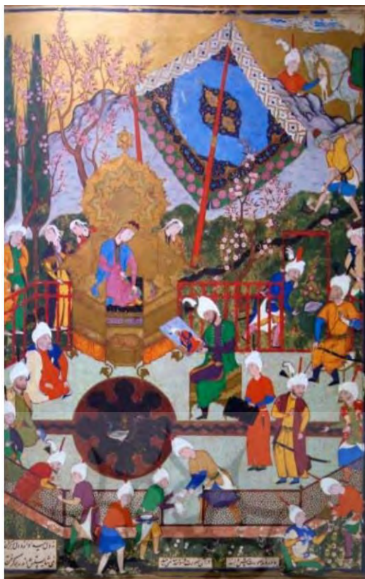
تصویر ۳: نگاره بازشناسی نوشابه، اسکندر را از تصورش، میرزاعلی، خمسه شاه طهماسبی (منبع: رجبی، ۱۳۸۴: ۵۸)

جغرافیای مکانی در تصویرسازی‌های موجود در منظومه‌های غنایی بالا کاربرد دارد که در ادامه بحث به مواردی از آن اشاره شده است.