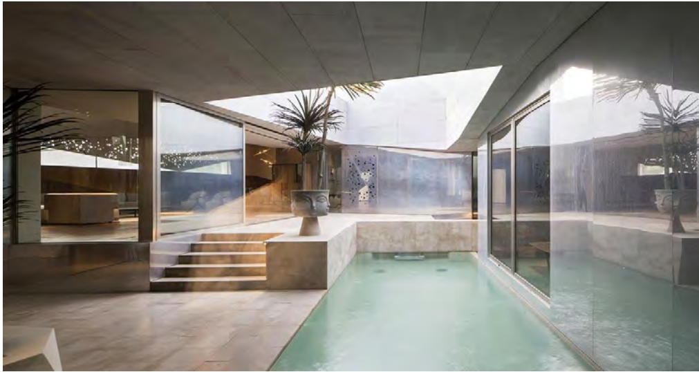
شکل ۲: خانه مسکونی الهام گرفته از طرح اورینگامی (کویت) (Internet)

طراحی سیرکولاسیون داخلی ساختمان، به گونه‌ایست که دسترسی به تمام فضاها با توجه به انعطاف‌پذیری در طراحی به راحتی صورت می‌گیرد. همان‌گونه که در معماری سنتی اسلامی، از ابعاد بزرگ راهروها اجتناب می‌شود در طراحی این خانه نیز اصول اسلامی در آن به خوبی رعایت شده است. فضای لندسکیپ موجود در حیاط مرکزی و فضاهای منفی در کنار توده‌های ساختمان به خوبی حل شده‌اند. نکته منفی که در مورد طراحی خانه می‌توان اشاره کرد، استفاده بیش اندازه از خطوط تیز و شکسته که در تضاد با طراحی فضای مسکونی می‌باشد، زیرا در خانه داشتن آرامش و راحتی الویت اصلی است. با توجه به اهمیت ساختارها، به لحاظ سنتی آن‌ها شامل زاویه‌های راست و سطوح صاف هستند. این نشانه‌ها را بندرت می‌توان در طبیعت مشاهده کرد. از آنجائی که ما به دنبال ساخت ساختمان‌هایی هستیم که از طبیعت تقلید می‌کنند، می‌توانیم شکل آن‌ها را مشاهده کرده و از معماری سنتی جدا شویم. با استفاده از اشکال دایره‌ای و سهمی‌وار درون طبیعت، می‌توانیم ساختمان‌های مؤثر بیشتری به لحاظ ساختاری و بوم‌شناختی بسازیم. در دنیای پیچیدگی و وسایل زندگی مصنوعی، انسان‌ها می‌توانند چیزهای زیادی را درباره‌ی گیاهان و حیوانات اطراف خود بیاموزند. بیونیک نه تنها در معماری کاربردپذیر است بلکه می‌توان آن را در نظام‌های دیگر نیز مورد استفاده قرار داد. طبیعت در چند میلیارد سال گذشته فرآیندها و اشکال خود را از طریق تکامل تدریجی بهبود و تغییر داده است. ما به عنوان یک انسان می‌بایست برای بهبود زندگی و کاهش تأثیر خود بر طبیعت مادر، به پیشرفت‌های دیگر جانداران بنگریم.