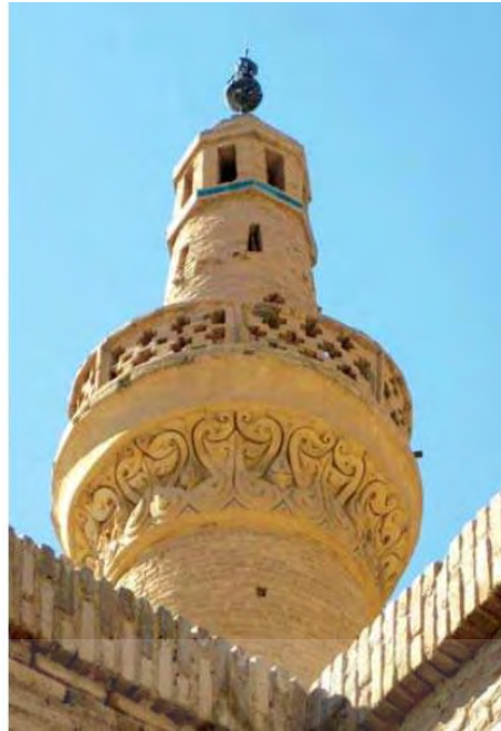
تصویر ۵: مناره مسجد نایین، وجود آرایه‌های گیاهی، منبع: (خوانساری و نقی زاده، ۱۳۹۳: ۵۱).

در تصویر شماره (۵) که نمایی از مناره مسجد نایین است، بازم ترکیب نقوش گیاهی منظم و تزئین با آجر دیده میشود، این ویژگی آن را نماینده سبک خاص معماری در دوره آل بویه ساخته است.