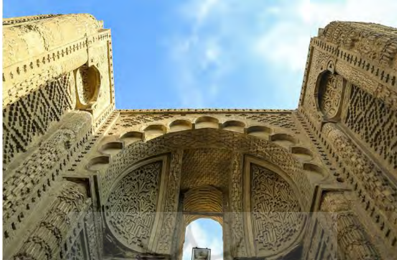
تصویر ۱: سردر مسجد جرجیر در اصفهان، متعلق به قرن چهارم هجری.

تزئینی به صورت قرینه برجای مانده است (پیرنیا، ۱۳۴۳: ۳۸۷). در تصویر شماره (۱) به طور دقیق این ورودی با ستون‌های قرینه قابل مشاهده است.