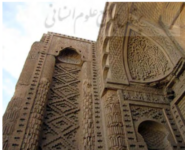
تصویر ۲: نمایی از ورودی مسجد جرجیر در اصفهان، متعلق به قرن چهارم هجری: منبع: (نگارنده)

بررسی زیباشناختی نقوش تزئینی موجود در این سردر نشان می‌دهد که نقوش گل و برگ، شمعدان‌های سه شاخه، نقوش لاله‌گون، تزئینات زنجیری و طرح‌های خطی هفت شاخه، کتیبه‌های کوفی بر آن وجود دارد. برجسته‌ترین این نقوش در سردر مسجد، نقوش یازده پر شکنج یا کنگره‌ای است که بر بالای سردر قرار دارد (رسولی، ۱۳۸۴: ۳۶). این ویژگی بنا را از نظر زیبایی‌شناسی تبدیل به یکی از ماندگارترین الگوهای برجای مانده از دوره آل بویه تبدیل کرده است. این بنا، تمثیلی از امتداد نقوش تزئینی از دوره باستان به دوره اسلامی است. در تصویر شماره (۲) اوج به کارگیری نقوش گیاهی و هندسی قابل مشاهده است.