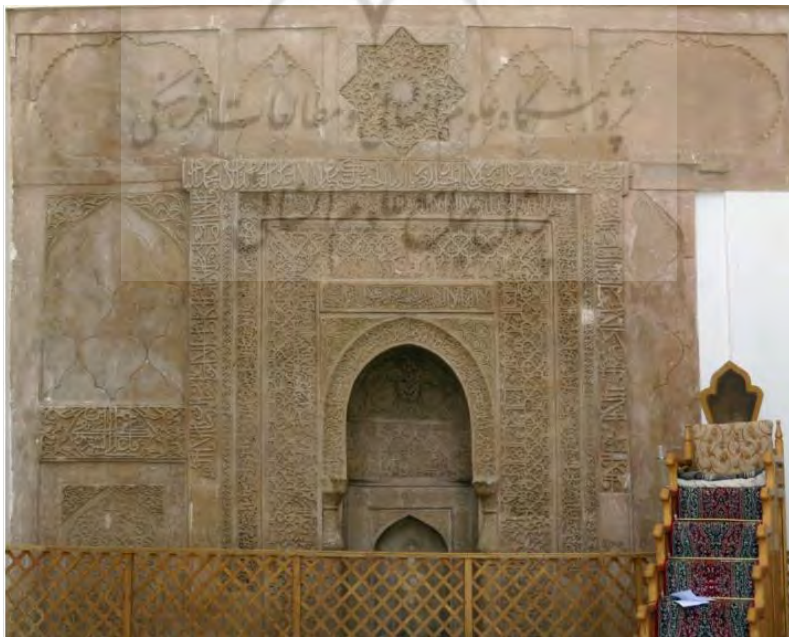
تصویر ۸: محراب مسجد جامع نیریز، متعلق به قرن چهارم هجری

در محراب این مسجد تزئینات زیادی از نقوش گیاه پالم، نقوش شاخ و برگ مو و نقش کنگر هستند. داخل محراب آن نیز کتیبه‌ای وجود دارد که اطراف آن با نقش گل‌ها تزئین شده است (انصاری، ۱۳۶۵: ۳۵۹-۳۵۸). در تصویر شماره (۸) ترکیب کتیبه‌نگاری منقوش به آیات قرآنی با نقوش گیاهی که یادآور معماری دوره باستان ایران است دیده می‌شود.