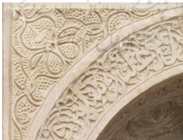
تصویر ۱۰: لچگی طاق نمای بیرونی با تزئینات گیاهی مربوط به مسجد جامع نیریز (منبع: تقوی نژاد و مؤذنی، ۱۳۹۵: ۸۰).

از عناصر پایدار معماری در دوره آل بویه مناره در مسجد بود. این مناره دارای ستون‌های گرد بودند. مناره مسجد جامع نیریز یکی از این مناره‌ها است. تزئین بوسیله مصالح به کار رفته شده یعنی آجر از ویژگی‌هایی سبک معماری آل بویه است که در این بنا مشهود است. مناره مسجد جامع نیریز نیز با آجر تزئین شده است.