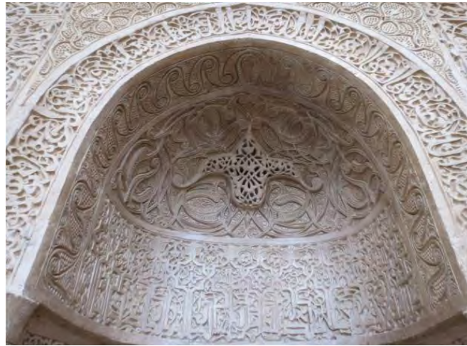
تصویر ۱۱: زیر قوس طاق نمای مسجد نیریز، (منبع: تقوی نژاد و مؤذنی، ۱۳۹۵: ۸۰).

این نما انعکاسی از سبک زیبای دوره آل بویه است که ترکیبی از عناصر هنر اسلامی و هنر در دوره باستان است که در تزئین این مسجد تاریخی بسیار چشم‌نواز است. کتیبه‌های منقوش به آیات و اسماء الهی در کنار نقوش و تزئینات گل و گیاهان در زیبایی این اثر نقش مهمی دارد. عنصر گچ‌بری از یادگارهای معماری ایران در دوره باستان است. این هنر زینت بخش بسیاری از کاخ‌ها و بناهای قبل از دوره اسلامی بوده است. نقوش گیاهی در گچ‌بری‌ها مانند نقوش نخل، تاک و پیچک، انگور و انار، گل نیلوفر آبی و گل چندپر، بلوط و انجیر از نقوش تزئینی دوره باستان هستند که در مسجد جامع نائین هم قابل مشاهده هستند. البته ذکر این نکته ضروری است که با توجه به منع اسلام در کشیدن نقوش انسانی و حیوانی، نقوش گچ‌بری‌ها محدود به نقوش گیاهی به همراه کتیبه‌هایی از آیات قرآنی شد (اعظمی و دیگران، ۱۳۹۲: ۱۵).