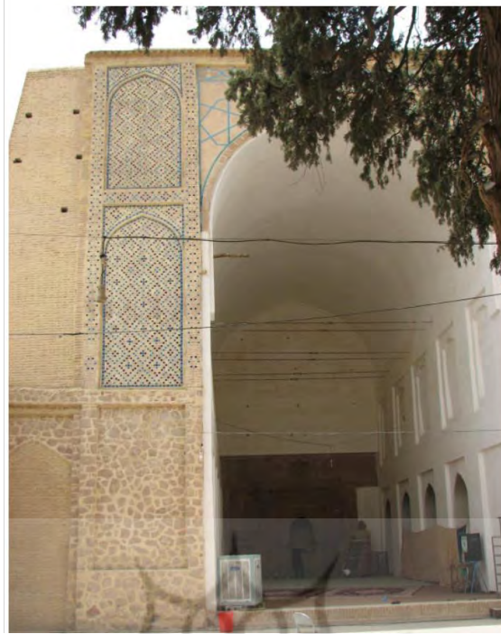
تصویر ۷: مسجد جامع نیریز، تک ایوانی، مربوط به قره چهارم هجری، منبع (تقوی نژاد، مؤذنی: ۱۳۹۵: ۷۹).

در محراب این مسجد تزئینات زیادی از نقوش گیاه پالم، نقوش شاخ و برگ مو و نقش کنگر هستند. داخل محراب آن نیز کتیبه‌ای وجود دارد که اطراف آن با نقش گل‌ها تزئین شده است (انصاری، ۱۳۶۵: ۳۵۹-۳۵۸). در تصویر شماره (۸) ترکیب کتیبه‌نگاری منقوش به آیات قرآنی با نقوش گیاهی که یادآور معماری دوره باستان ایران است دیده می‌شود.