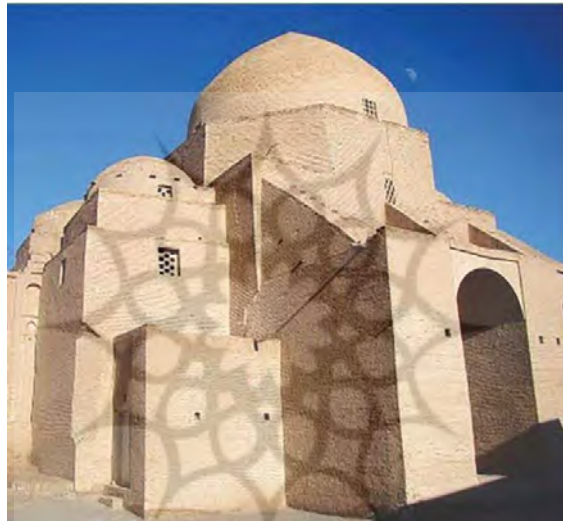
تصویر ۳: نمایی از مسجد جامع نطنز، متعلق به قرن چهارم هجری.

از دیگر بناهای متعلق به دوره آل بویه می‌توان به مسجد جامع نطنز اشاره کرد. از بُعد تزئینات و نقش‌های زیبای آن قابل توجه است. این مسجد چهار ایوانی دارا کتیبه‌های متعددی است. ایوان آن دارای گچ‌بری و مقرنس‌کاری است (کیانی، ۱۳۷۶: ۱۷۶-۱۷۵). یکی از ویژگی‌های معماری ایران به خصوص در دوره آل بویه، بهره‌گیری از تزئینات با مصالح و اشکال گوناگون است. تصویر شماره ۳، نمایی از مسجد جامع نطنز است که مجموعه‌ای از گنبدخانه، ایوان و کاربست آجر در بنا و تزئین را نشان می‌دهد.