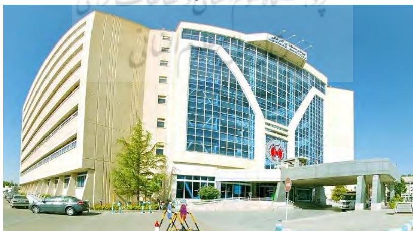
شکل ۳. ساختمان بیمارستان کوثر، ماخذ: سایت بیمارستان کوثر، ۱۳۹۹