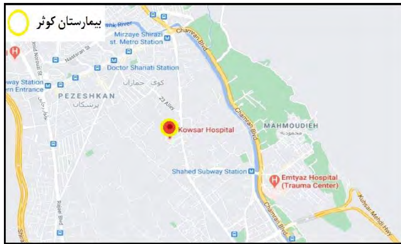
شکل ۱. محدوده بیمارستان کوثر، ماخذ: گوگل ارث، ۱۳۹۹

بیماران و مراجعین خود از اقصی نقاط ایران، ارائه نماید ۱ در سال ۱۲۸۶ هجری شمسی مرحوم حیدر علی خان عز الملوک در محل فعلی بیمارستان یک مریضخانه احداث نمود و نصف درآمد حاصل از عایدات یک روستا در منطقه درود زن را وقف درمان بیماران بی بضاعت آن نمود. در سال ۱۳۲۲ توسط شهرداری وقت در این محل یک بیمارستان مجهز احداث گردید ۲ .