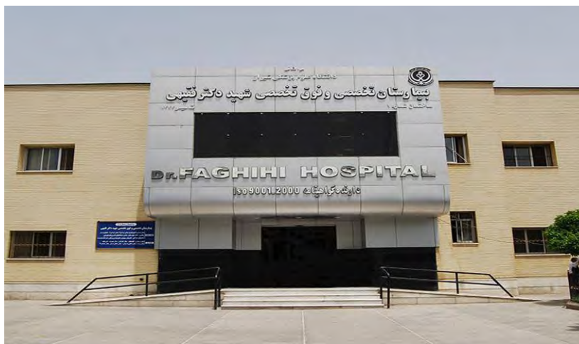
شکل ۴. ساختمان بیمارستان فقیهی، ماخذ: سایت بیمارستان فقیهی، ۱۳۹۹